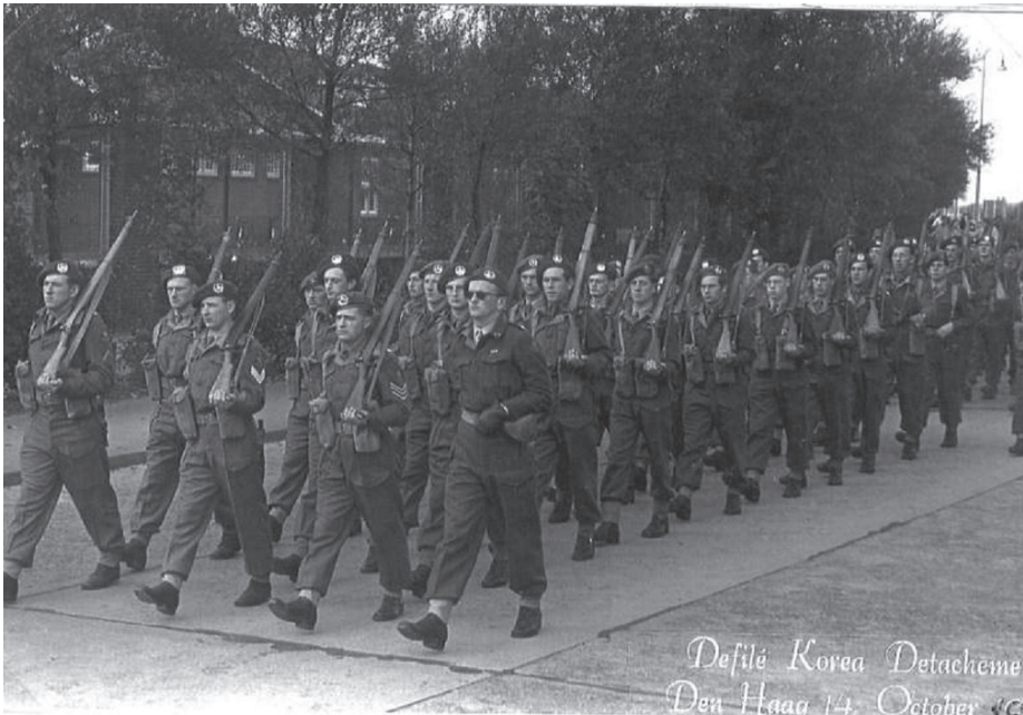
3e Peloton A-Compagnie.