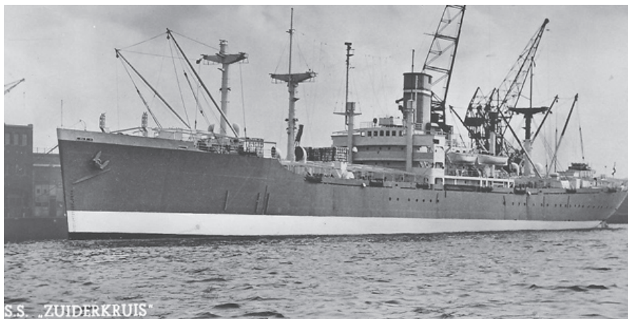
Met de S.S. "Zuiderkruis" vertrokken we naar Pusan.

C-Compagnie werd later gevormd en kwam als aanvulling op een later tijdstip.