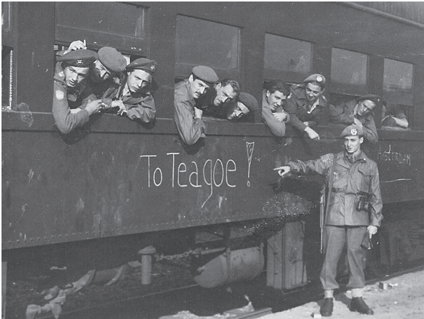
Met de trein van Pusan naar Taegu.

Op een zeker moment toch verder, naar het station, ongeveer een kwartier lopen. Diverse malen werd er gestopt om onduidelijke redenen. De eerste handeling was dan de plunjezak op de grond te leggen. Je nam hem pas op tegen de tijd dat de jongens voor je het gingen doen en niet als het bevel werd gegeven. Anders stond je veel te vroeg als een soort 'Atlas' met een zwaar voorwerp op je nek. De plunjezakken hadden het onderweg opnieuw zwaar te verduren. Regelmatig hoorde je een smak op de grond. De eigenaar mopperde en was moe, soms werd het ding verder over de grond gesleept. Als je de plunjezak goed in balans op je schouders had en rustig doorstapte, had je geen probleem.