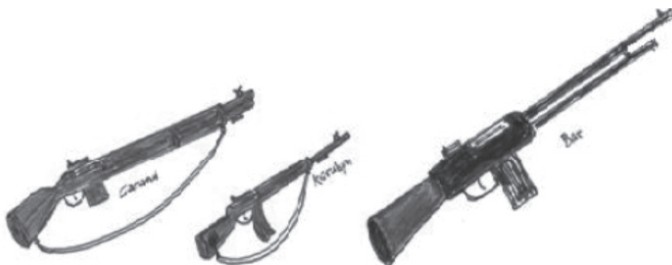
Garand, Karabijn en BAR (lichte mitrailleur).