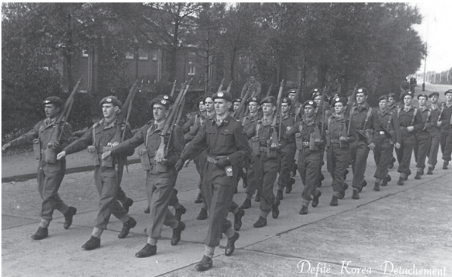
3e Peloton waarschijnlijk B-Compagnie.