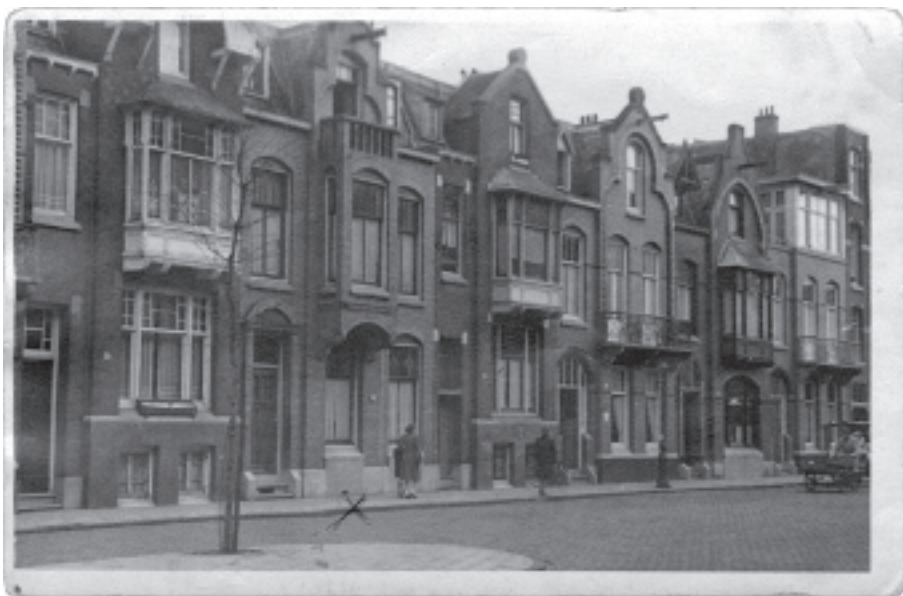
Het huis aan de Linnaeusparkweg, nummer 57 is met een kruisje aangegeven.

haar naam voortaan als 'Henny' te spellen. Een klein meisje dat heel gewenst was en vanaf het moment dat ze geboren werd het middelpunt van het gezin vormde.