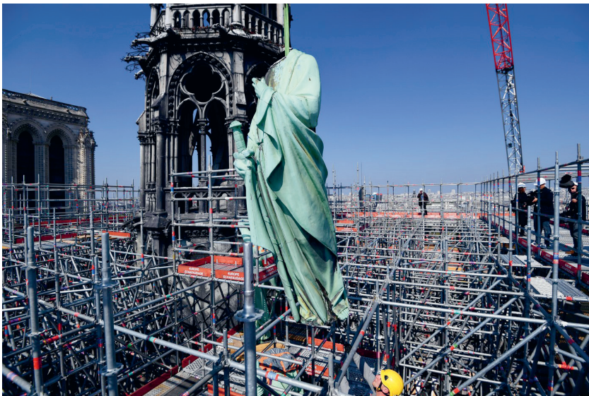
Herstelwerkzaamheden aan de Notre-Dame te Parijs na de brand van 2019.

Van mij mogen ze het Parthenon platbranden en de Sixtijnse kapel met de grond gelijkmaken, als dat het leven van één kind, één mens kan redden. Zijn we nou helemaal gek geworden?