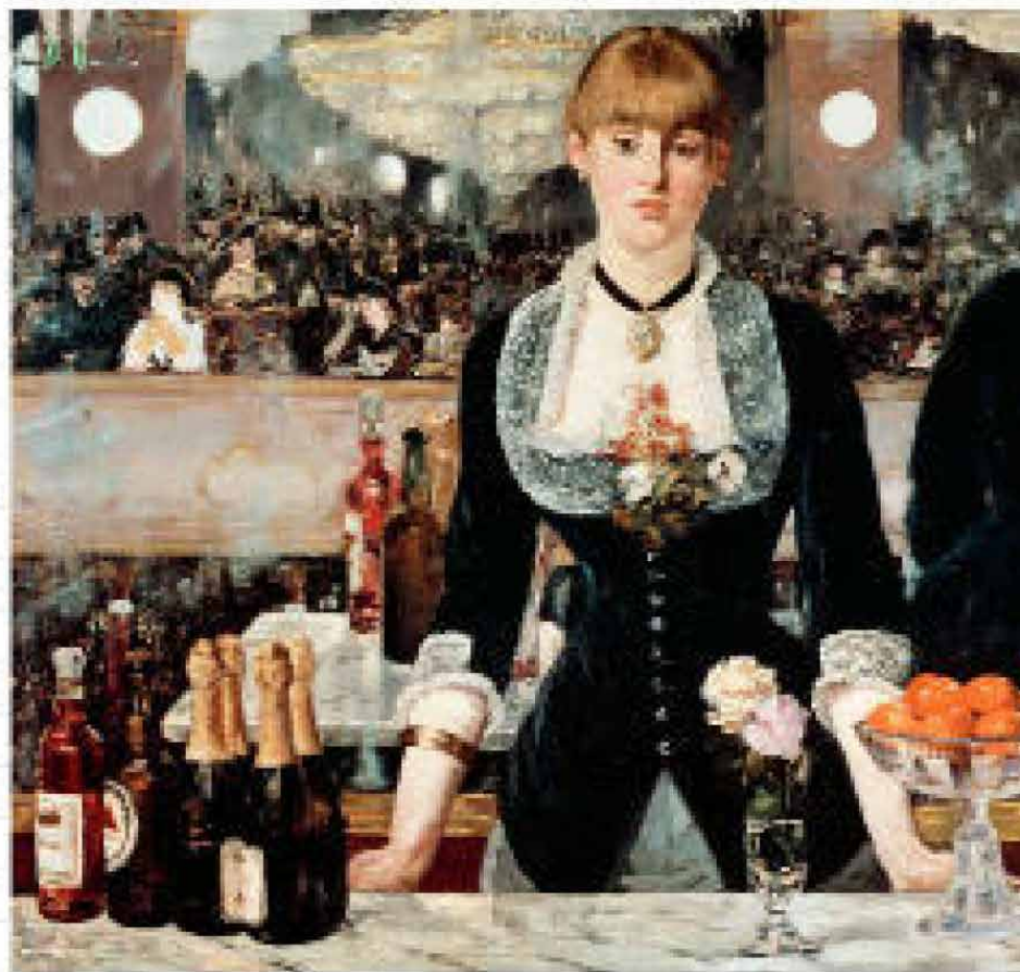
EEN BAR IN DE FOLIES-BERGÈRE Édouard Manet 1882 Courtauld Institute of Art Gallery, Londen

Met dat doel zijn 20 details van de schilderwerken in dit boek licht gewijzigd. Het origineel staat op de linkerbladzijde, de veranderde versie staat rechts. Hoe meer je elk schilderij bestudeert en hoe meer verschillen je opspoor, des te vertrouwder zul je raken met elke vierkante centimeter van deze beroemde meesterwerken, en als beloning zul je een grondig inzicht hebben gekregen in datgene wat deze werken zo bijzonder maakt.