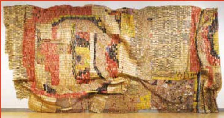
Installatie van El Anatsui's Earth's Skin , 2007, in het Brooklyn Museum, New York.