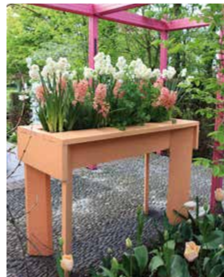
Onder Zelfgemaakte bak als blikvanger.