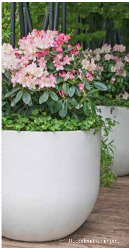
Rhododendron in pot.