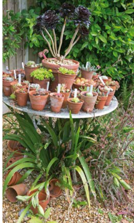
Boven Verzameling van vetplanten.

Voor een pot kun je gemakkelijk elk jaar een andere beplanting bedenken. Denk eens aan een beplanting met opeenvolgende bloei: bloemen van april tot in de herfst, in één pot. Of je maakt een pottenborder met bladplanten, zet eetbare planten in blikken, beplant een hangend basket vol geurige kruiden of ontwerpt een miniborder in een oude dakgoot. Heb je inspiratie nodig? Verderop in dit boek heb ik ruim veertig voorbeelden van fraai beplante potten verzameld die je eenvoudig zelf kunt maken.