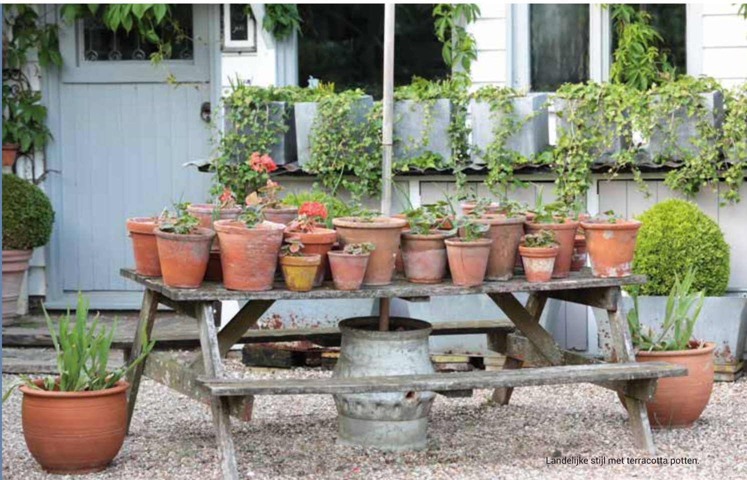
Landelijke stijl met terracotta potten.

oppervlakkig en kan dus in een ondiepe pot. Maar een heester die jarenlang in een pot groeit, heeft al gauw minimaal 40 liter grond nodig. Grote, zware potten zijn moeilijk te verzetten, waardoor je ze beter een vaste plek in het ontwerp kunt geven. Maar een forse pot met daarin een prachtige solitaire maakt natuurlijk wel indruk.