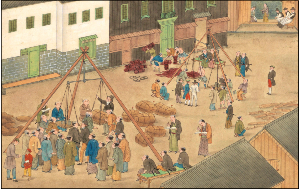
Nederlandse factorij Deshima / Dutch factory Deshima, Kawahara Keiga

De handel op Deshima is in eerste instantie uiterst lucratief, maar begint aan het begin van de 18e eeuw af te nemen door handelsbeperkingen die worden opgelegd. Zo mogen er nog maar 2 Nederlandse schepen per jaar aanmeren. De Nederlanders verhandelen voornamelijk zijde, katoen, hertenhuiden en suiker. De Japanners leveren koper, zilver, porselein, lakwerk, kamfer en rijst.