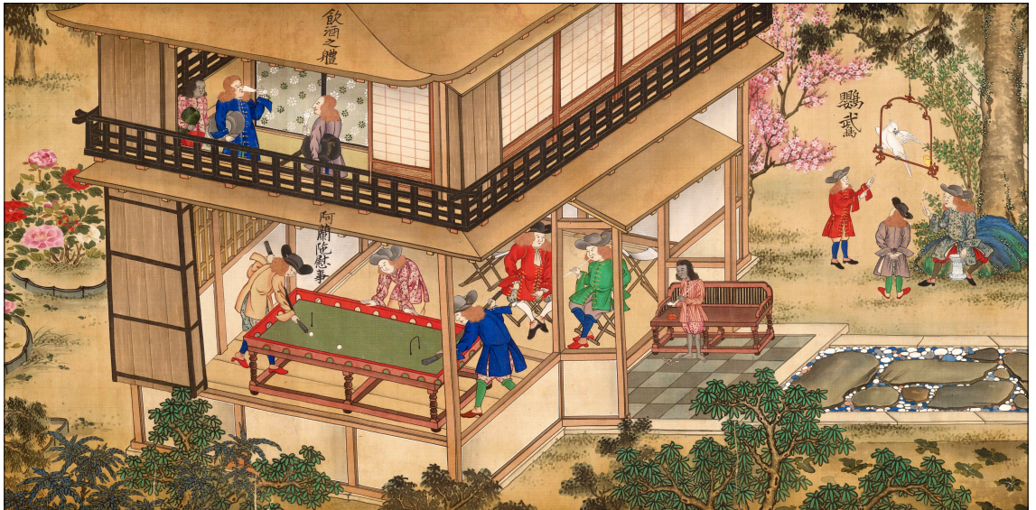
Ontspanning op Deshima / Relaxation on Deshima, Watanabe Shuseki

A limited number of Dutch people are allowed to stay on Deshima, 20 at the most. These are usually the chief, the warehouse manager, some merchants and assistants, such as the doctor, clerk and bookkeeper. At the end of the trading season, from August to November, most of them leave Japan again. Dozens of Japanese people work on the island, including a cook, porter, interpreter, fire-watcher and gatekeeper.