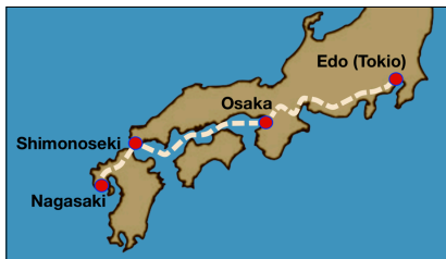
Route hofreis / Court journey route