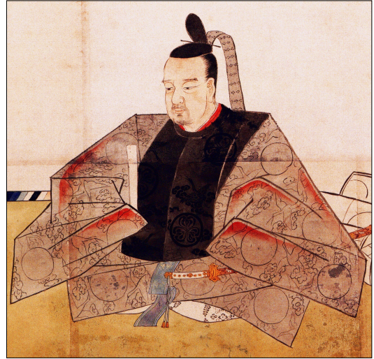
Shogun Tokugawa Ienara, Kanō Osanobu

Two centuries ago, the shogun is the absolute ruler of Japan, due to its military power. Without any authority, the emperor is kept in a kind of golden captivity in his court in Kyoto. De facto, the shogun is ruling the country from the city of Edo. This is the former name of Tokyo and means “Capital in the East”. During the Tokugawa shogunate (1603 - 1867), Tokugawa Ienara (1773 - 1841) is the 11th shogun of the Edo period, as the Tokugawa shogunate is also referred to.