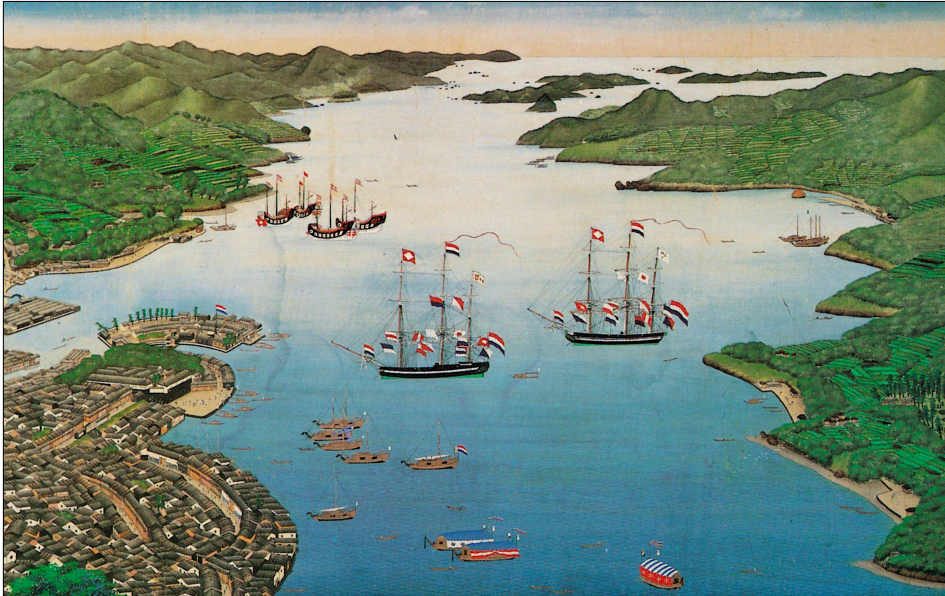
Baai van Nagasaki / Nagasaki Bay, Kawahara Keiga

Deshima is een kunstmatig eilandje in de Baai van Nagasaki dat als Nederlandse handelspost fungeert. Deshima betekent in het Japans “eiland dat uitsteekt”. De Nederlanders hebben in de periode 1641 - 1859 van hieruit goederen en kennis aan de Japanners geleverd. Buiten het eiland is het de Nederlanders ten strengste verboden contacten te onderhouden met Japanners.