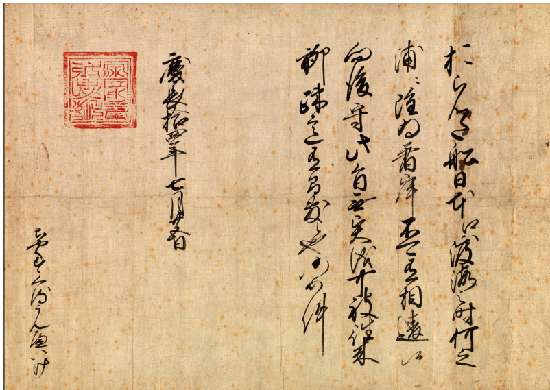
Handelspas voor Nederlanders in Japan / Trade pass for Dutch in Japan

During the Edo period, the Sakoku policy is strictly enforced. Sakoku literally means “closed country” in Japanese. This policy transforms Japan into a country which is isolated from the rest of the world. Foreigners are expelled and there is a ban on entering the country. The Netherlands is the only Western country that’s allowed to maintain relations with Japan, but limited and only at the trading post Deshima.