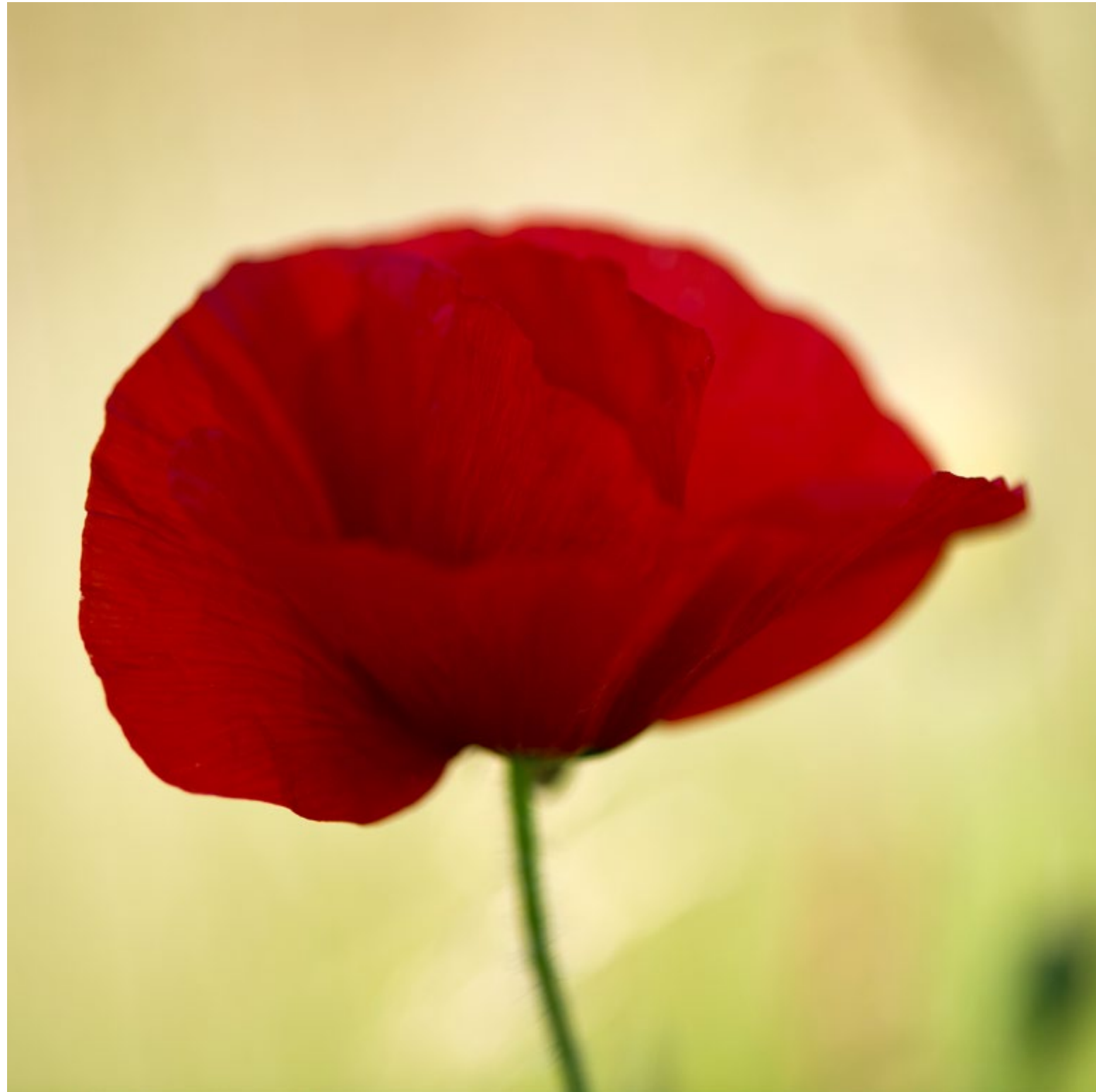
Heiloo, The Netherlands, 2011

Open your heart for Mother Nature, for she connects us to all that lies within .