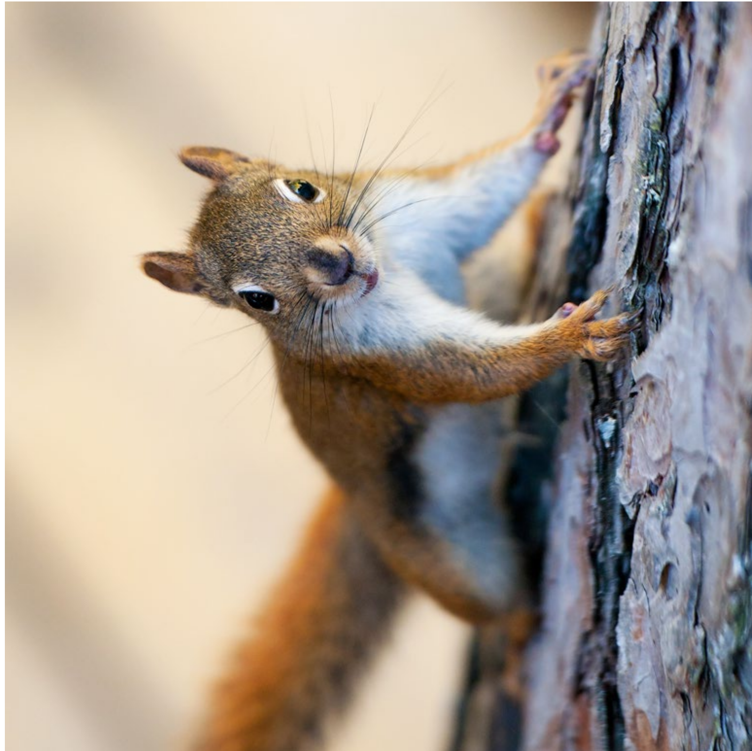
Ely, Minnesota, North America, 2010