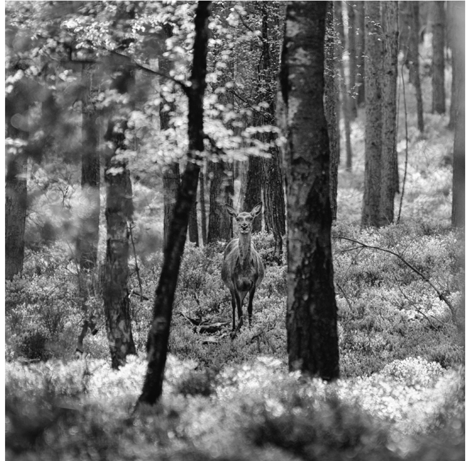
Vierhouten, The Netherlands, 2021