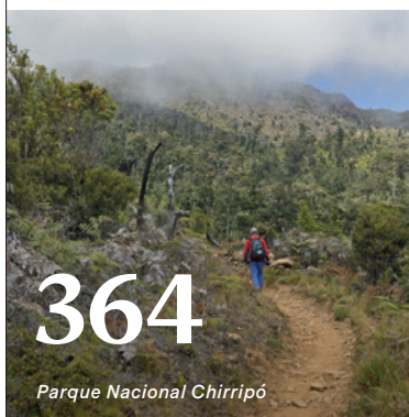
Parque Nacional Chirripó