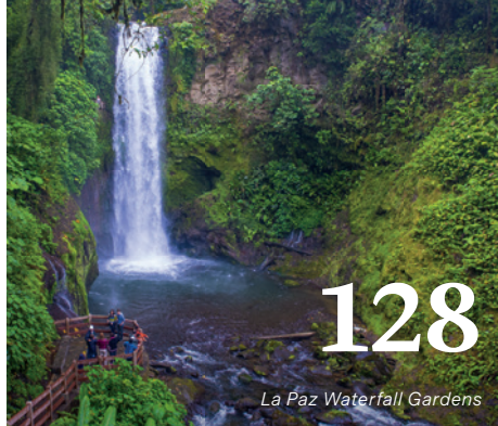
La Paz Waterfall Gardens