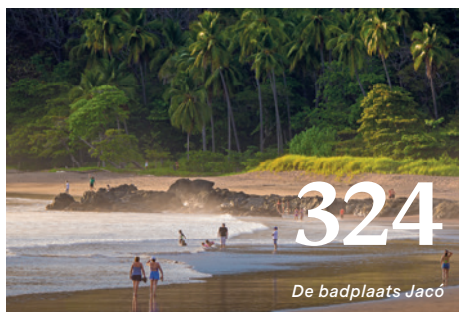
De badplaats Jacó