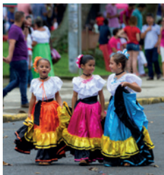
↑ Viering Onafhankelijkheidsdag