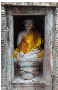
↑ Wat Nokor, een pre-Angkoraans boeddhistisch heiligdom