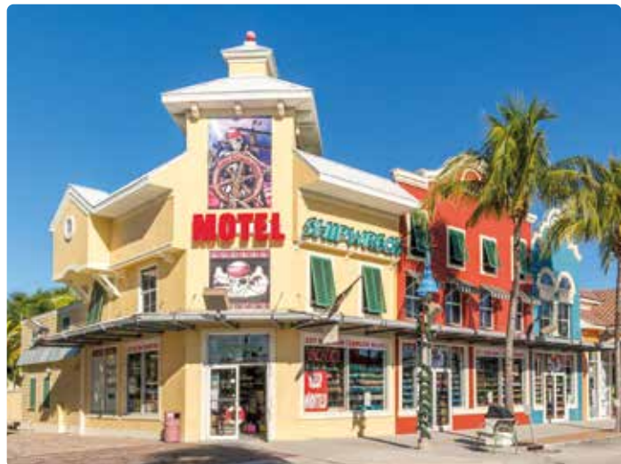
► Klassieke stijl van rond 1900: motel en een kleine rij winkels in Fort Myers Beach

Sommige resorts vragen een behoorlijk fikse resort fee , een vast bedrag voor het gebruik van internet, sporttoestellen of handdoeken bij het zwembad. Dit is eigenlijk een verkapte toeslag, die meestal reeds bij de prijs is inbegrepen als u vooraf een pakketreis boekt.