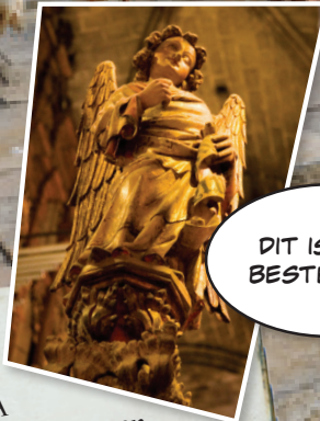
Engel in La Seu