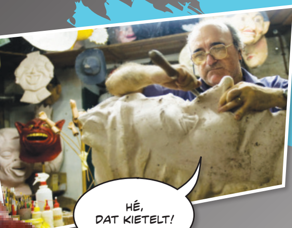
Een nieuwe reus aan het bouwen

Elke buurt in Barcelona heeft zijn eigen reuzen en grote koppen. Ze worden gebruikt bij lokale feestelijkheden en zijn gemaakt van papier-maché en gips op een houten geraamte.