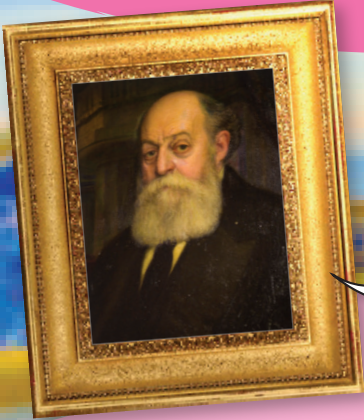
Een portret van Antoni Gaudí, Barcelona's beroemde bouwkunstenaar

Antoni Gaudí is een van de grootste artistieke helden van Barcelona. Zijn gebouwen zijn echte pareltjes, die door de stad worden gekoesterd (zie p. 18, p. 34 en p. 35). Nergens vind je zo'n wonderlijk park als zijn Park Güell. Hij werd in 1852 geboren in Reus, Tarragona.