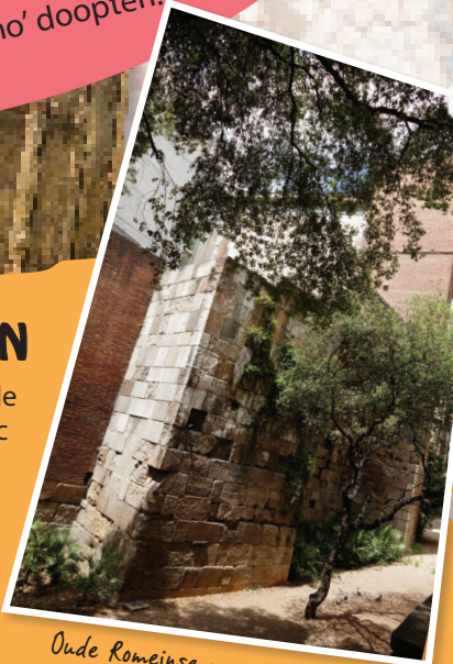
Oude Romeinse muren staan her en der verspreid.

De Romeinen bivakkeerden in de stadswijk die we nu Barri Gòtic noemen, de gotische wijk. Hier en daar tref je nog resten aan van de stadsmuur en een tempel gewijd aan Augustus, die keizer was toen Barcino werd gesticht.