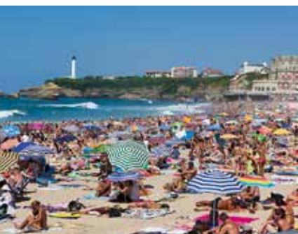
Hoogseizoen in Biarritz

Tip: verleng deze route met een dag en trek het achterland in voor een bezoek aan Cambo-les-Bains ( blz. 208 ) en Espelette ( blz. 205 ).