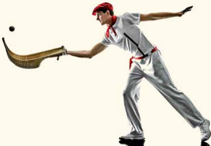
Een Baskische pelottespeler (met chistera en baret)