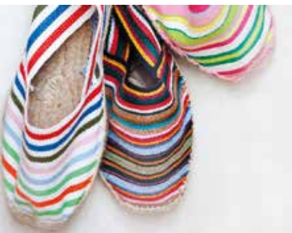
Baskische espadrilles

♥ Beleef een exotische middag in Hendaye. Het neogotische kasteel van de Baskische ontdekkingsreiziger, wetenschapper en mecenas Antoine d'Abbadie staat vol verrassende curiositeiten, het park eromheen vol bomen uit verre landen. Zie blz. 186.