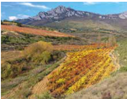
De wijngaarden van de Rioja Alavesa

Tip: je kunt deze route verlengen door via Estella-Lizarra en Puente-la-Reina naar Pamplona te gaan (blz. 500) en van daaruit de route door Navarra te rijden (blz. 25).