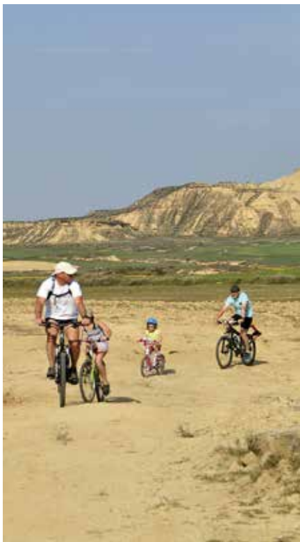
Fietsen in Las Bardenas Reales