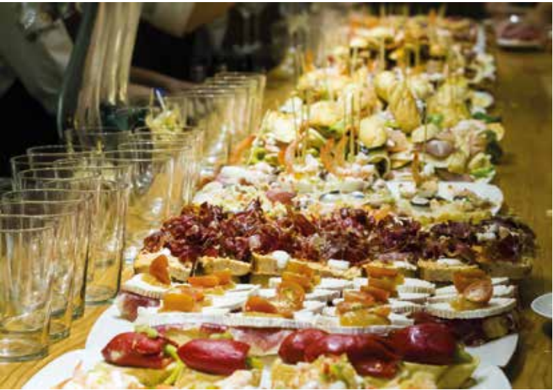
Pintxos zijn de tapas van het Baskenland.