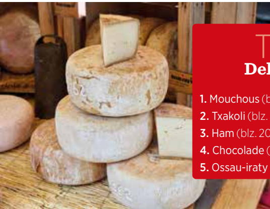
Ossau-iratykaas op de markt van Hendaye