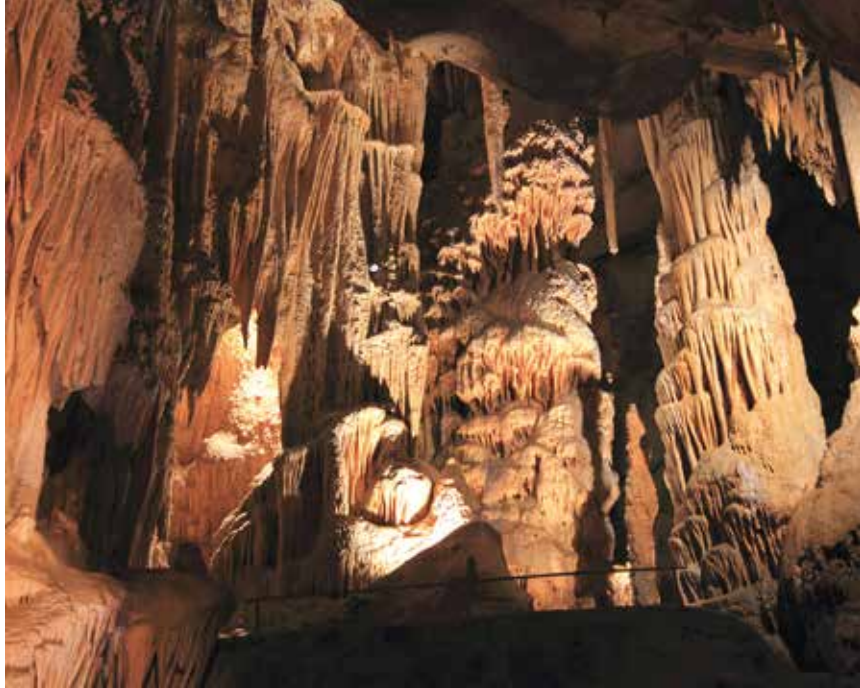
De grotten van Isturitz