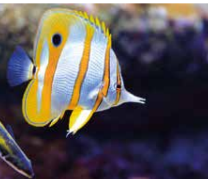
Het aquarium van Biarritz

Falaise aux Vautours, Béon. Aan de knoppen van een 360 graden-camera kun je de valse gieren van heel dichtbij bekijken. Het lijkt wel of je naast ze op de klif zit. In het museum leer je nog veel meer over deze fascinerende vogels: bekijk de films, speel de computerspellen en vlieg virtueel mee als ze hun enorme vleugels uitspreiden! Zie blz. 338.