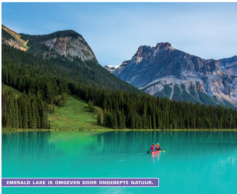
EMERALD LAKE IS OMGEVEN DOOR ONGEREPTENATUUR.

Burgess Shale: alleen in de zomer toegankelijk. Informatie en reserveringen: ☎ 1 877 737 37 83 🌐 reservations.parks canada.gc.ca . Rondleiding, reserveren verplicht (mogelijk vanaf febr.). Duur: $ 55-70, afhankelijk van de gekozen route, plus $ 11 reserveringskosten per groep, kortingen mogelijk. De kleischalie is een van de grootste vindplaatsen van fossielen ter wereld. De schalie zit vol bijzonder goed bewaarde resten van verschillende zeedieren uit het Cambrium. In 1909 werden de eerste fossielen ontdekt en sindsdien hebben ze een grote bijdrage geleverd aan de kennis over het ontstaan en de geschiedenis van de meeste diersoorten die we nu kennen. Alleen voor wie echt geïnteresseerd is en fit is, want de weg ernaartoe is niet gemakkelijk.