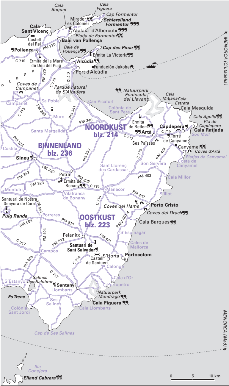
MALLORCA – OVERZICHTSKAART