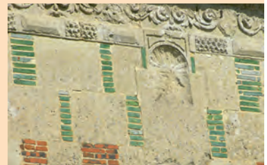
Detail van de gevel van het kasteel van Saint-Germain-de-Livet