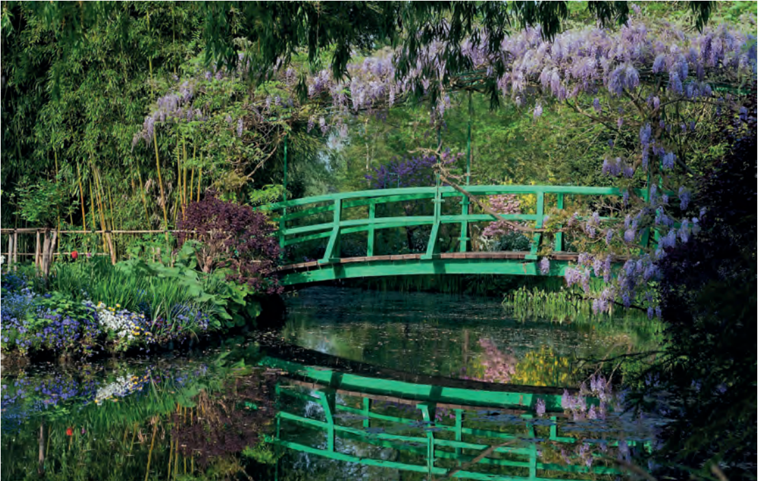
De vijver met het groene bruggetje, een bekend beeld uit de tuin van Claude Monet in Giverny

stad) en is met zijn historisch en natuurlijk erfgoed een populaire plek voor filmregisseurs. Maar lang voor zij de plek ontdekten, waren schilders dol op de schoonheid van deze plek. Vooral Pissarro (1830-1903) waardeerde deze plek. Hij woonde er bijna twintig jaar en leerde Cézanne er de schoonheid van het schilderen in de openlucht. In het museum dat naar hem werd genoemd, worden tentoonstellingen gehouden met werken uit de 19de eeuw van het impressionisme en het postimpressionisme.