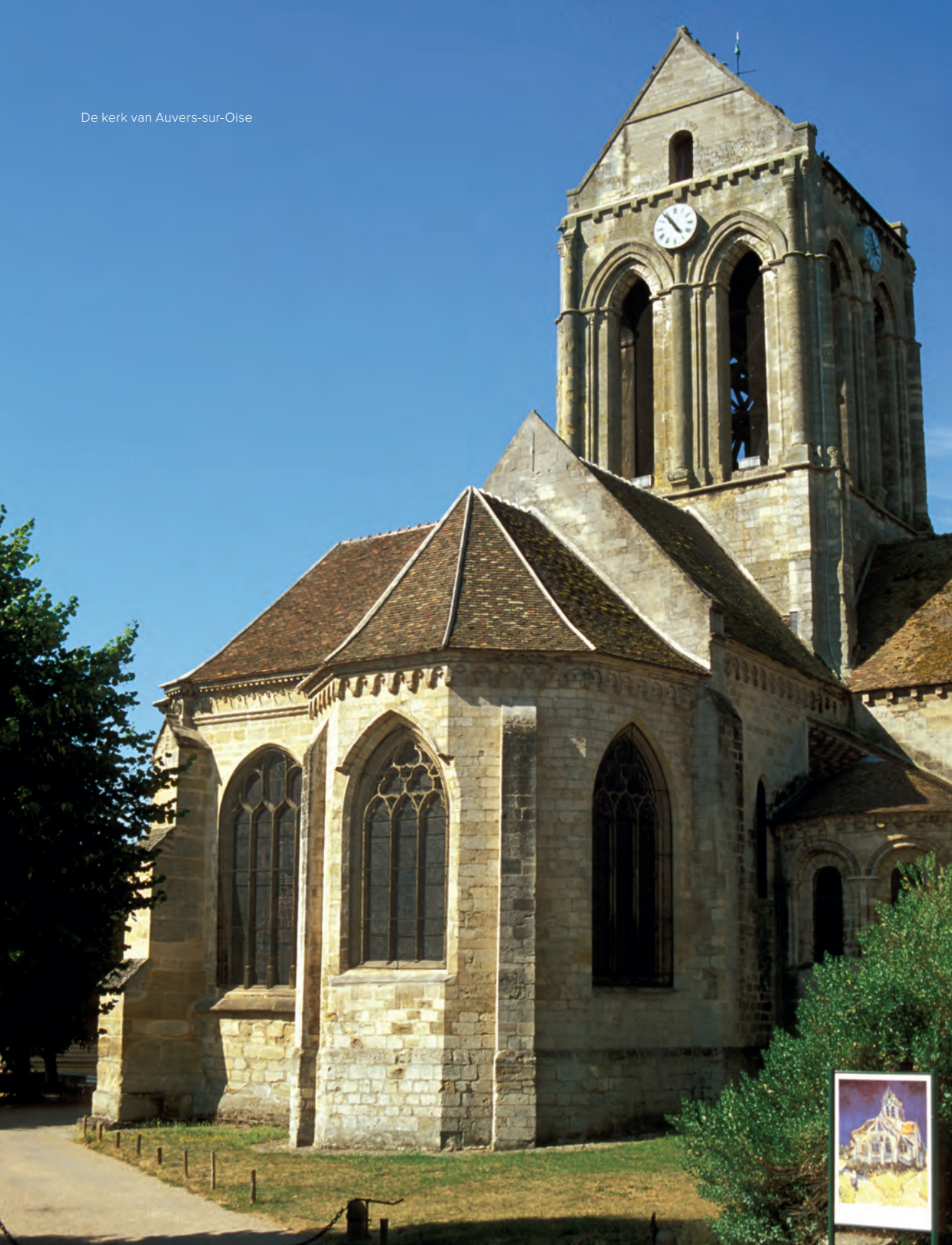
De kerk van Auvers-sur-Oise