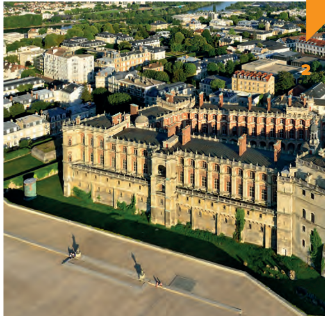
Het verfijnde kasteel van Saint-Germain-en-Laye heeft bijzonder verfijnde gevels.

Als je oostwaarts richting Parijs rijdt, kom je langs Mantes-la-Jolie waar belangrijke mijlpalen in het impressionisme plaatsvonden. De kapittelkerk, met haar sierlijke en lichte kerkschip dat bijna net zo hoog is als dat van de Notre-Dame in Parijs,