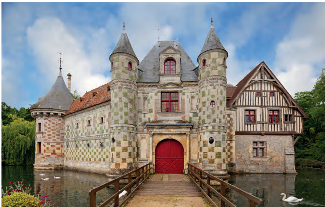
Het kasteel van Saint-Germain-de-Livet herken je meteen aan de opvallende gevel met dambordpatroon.

een van de parels van de streek. Het prachtige, 16de-eeuwse kasteel heeft een bijzonder mooie gevel met dambordpatroon, waar natuursteen en geglazuurde baksteen worden afgewisseld. Er is een sierlijke zuilengalerij in Italiaanse renaissancestijl. Het kasteel is absoluut een bezoekje waard voor de bemeubelde salons en de muurschilderingen in de wachterszaal. Werp een blik op de kerk in dit dorp. Ze wordt omringd door een tuin waarvoorheen een rivier loopt.