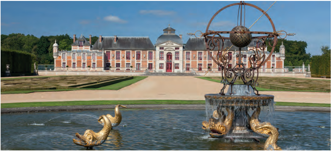
Het kasteel van Champ de Bataille is een van de meest luxueuze van Frankrijk.

Je bevindt je nu op het plateau van Neubourg, een hoogvlakte met een krijt- en kleibodem waarop graangewassen worden geteeld. Het nogal vlakke landschap is bezaaid met prachtige overblijfselen uit het verleden, zoals het Château d'Harcourt, de verblijfplaats van de gelijknamige familie. De voormalige middeleeuwse vesting staat te midden van een 11 ha groot arboretum waarin eeuwenoude bomen groeien. Het kasteel van Champ de Bataille met de Franse tuinen ligt enkele kilometers verderop. Het domein werd in