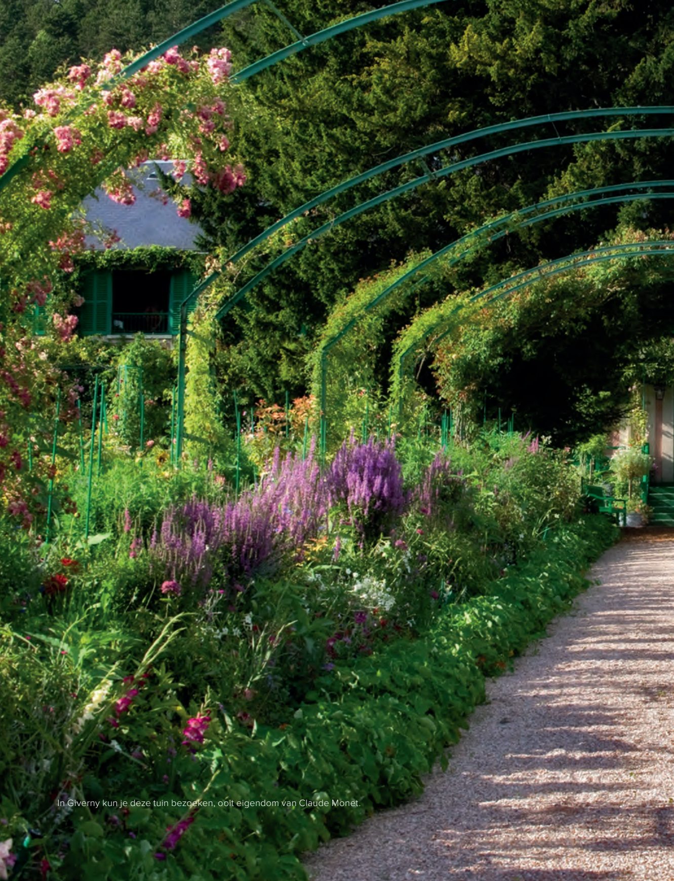
In Giverny kun je deze tuin bezoeken, ooit eigendom van Claude Monet.