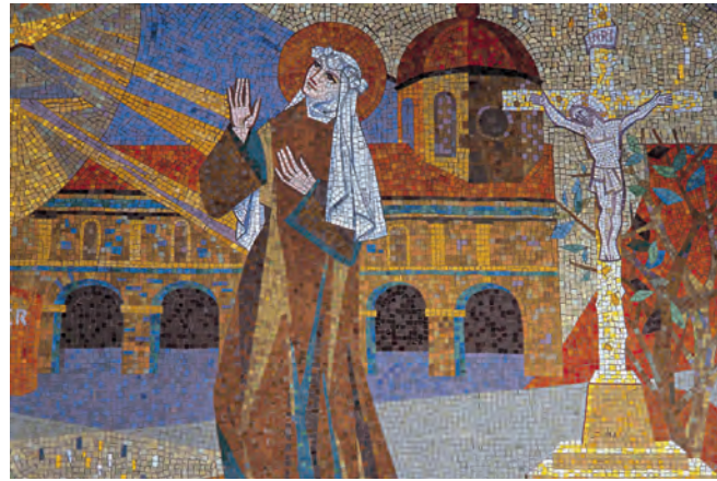
Detail van een mozaïek van de heilige Theresia in de basiliek van Lisieux

Na dit vrome bezoek zet je koers zuidwaarts. Enkele kilometers verderop ligt het Domaine