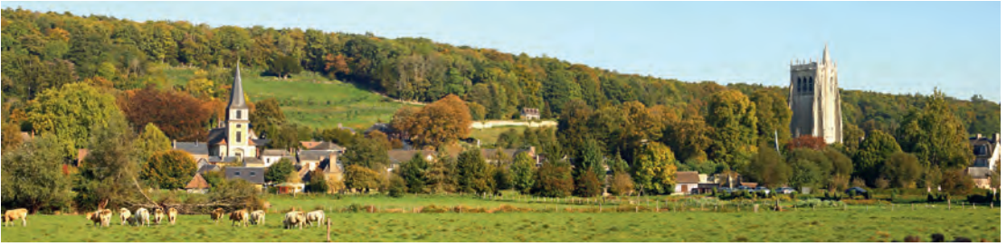
Uitzicht op het dorp Bec-Hellouin en de toren van de abdij