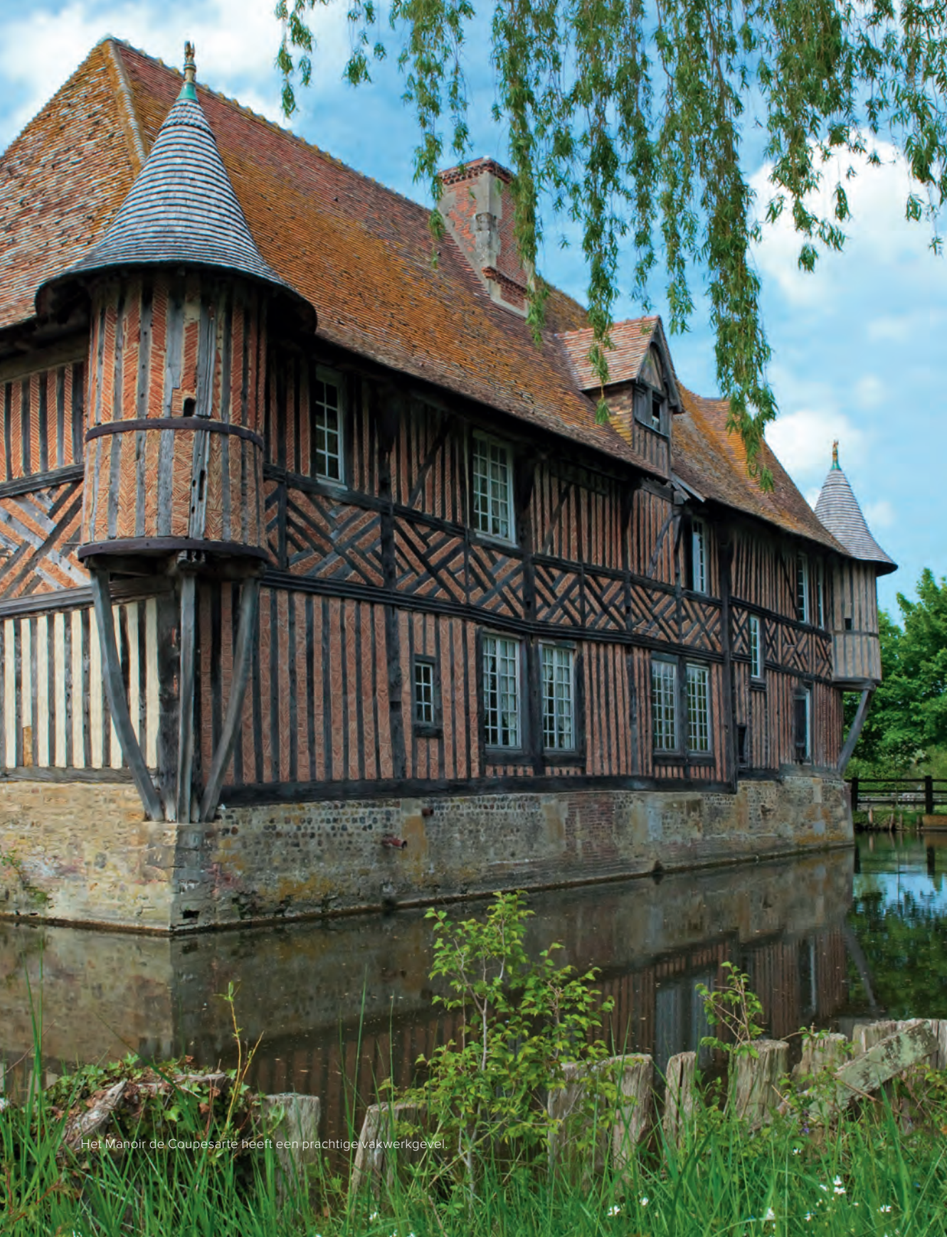
Het Manoir de Coupesart heeft een prachtige vakwerkgevel.