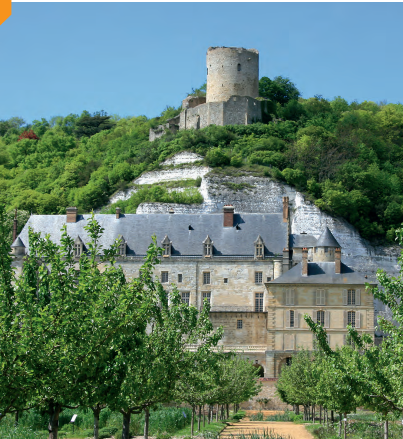
Het kasteel van La Roche-Guyon ligt tegen de heuvelflank gedrukt.