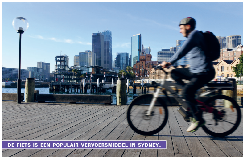
DE FIETS IS EEN POPULAIR VERVOERSMIDDEL IN SYDNEY.