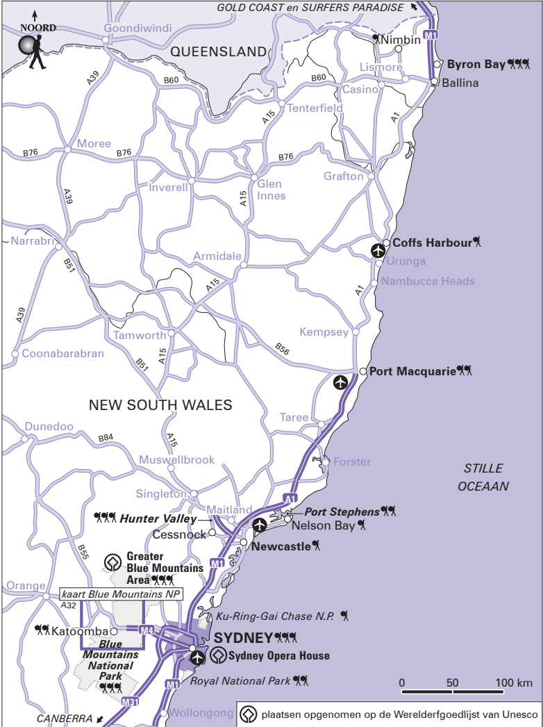
OVERZICHTSKAART NEW SOUTH WALES