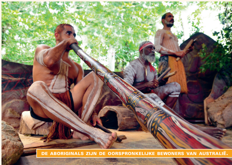
DE ABORIGINALS ZIJN DE OORSPRONKELIJKE BEWONERS VAN AUSTRALIË.

meester en neemt deel aan de mythe door bepaalde gebeurtenissen uit te beelden. Sommigen zagen natuurlijk hun kans schoon en profiteerden van deze gave van de kunstenaars onder de Aboriginals. Ze buiten ze uit en pakten grote winst met het verkopen van de kunstwerken. Nog andere, waaronder de regering zelf, respecteerden niet het heilige karakter van deze voorstellingen en gebruikten ze bijvoorbeeld op bankbiljetten. Maar alleen wie tot een totem behoort, heeft het recht een voorstelling te maken van de Droom waarmee hij is verbonden. Elke Aboriginalkunstenaar is dan ook verplicht telkens opnieuw, zijn leven lang, hetzelfde thema uit te beelden. Het enige waarin hij variatie kan aanbrengen, is zijn stijl. Toch heeft het contact met andere mensen niet alleen nadelen gehad. De Aboriginals zijn zo in contact gekomen met nieuwe materialen en zo konden ze kleuren gebruiken die ze nooit eerder hadden gebruikt en betere fixatiemiddelen. Sommige kunstenaars integreerden op talentvolle wijze nieuwe invloeden en artistieke stromingen uit het westen in hun werken.