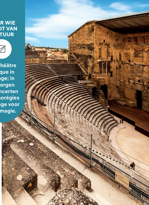
Het Théâtre Antique (blz. 149)

Het Théâtre Antique in Orange; in juli zorgen de concerten van Chorégies d'Orange voor pure magie.