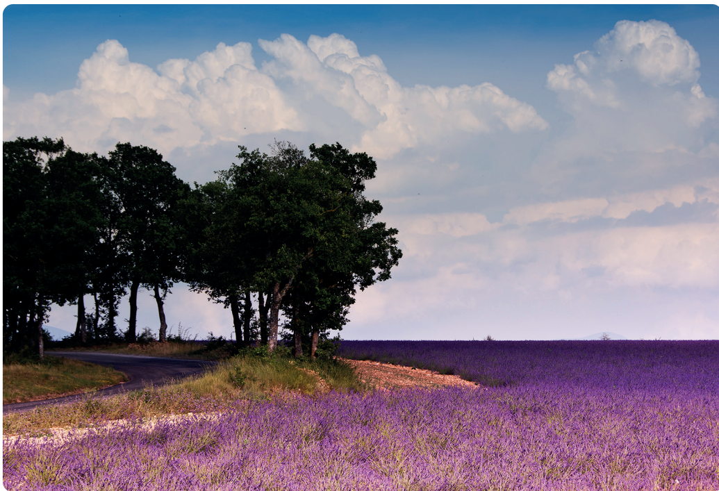
Lavendelvelden in de Provence (blz. 151)