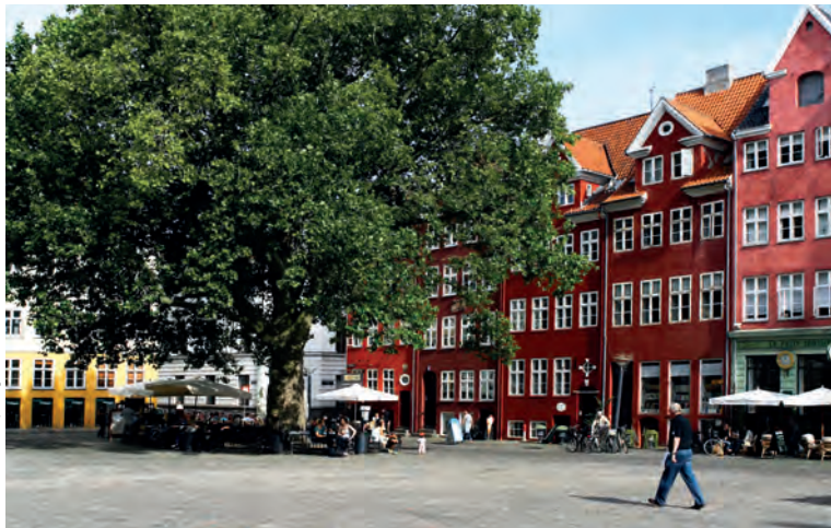
Het geplaveide Graubroedersplein is een echt plaatje.

Met zijn prachtige plataan is dit geplaveide pleintje in het oude Kopenhagen als een typisch Scandinavische ansichtkaart: aan de voet van de kleurrijke gevels worden de terrassen bij mooi weer meteen ingenomen door de buurtbewoners. Het plein werd verschillende keren vernield (door brand in 1728, door bombardementen in 1807) en werd in de 18de en de 19de eeuw heraangelegd. Zelfs de niet zo elegante, granieten, moderne fontein (1971) kan het idyllische plaatje niet verstoren. In de zomer worden er openluchtconcerten gegeven, vooral tijdens het Copenhagen Jazz Festival.