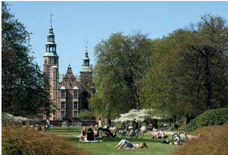
De Koninklijke Tuin (Kongens Haven) en Rosenborg Slot

zuiden van het Scandinavisch schiereiland. blz. 36.