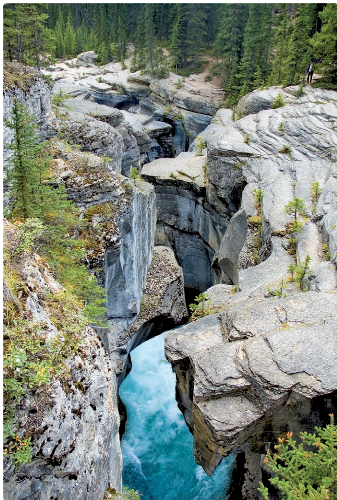
► De Mistaya Canyon in Banff National Park: de Mistaya River heeft zich hier diep in de rotsen ingegraven.

In grote bochten slingert de Bow Valley Parkway zich parallel aan de Trans-Canada Highway door het rivierdal. Van 1920 tot in de jaren 1950 was dit de eerste en enige verbinding tussen Lake Louise en Banff. Onderweg zijn er heel wat gelegenheden om te picknicken, kamperen of wandelen terwijl u bighorn -schapen of andere dieren kunt gadeslaan. 25 kilometer ten westen van Banff kunt u een korte wandeling maken naar de Johnston Canyon , een smalle kalksteenkloof met twee watervallen. Ongeveer halweg tussen Lake Louise en Banff rijst van achter het uitgestrekte, met bomen begroeide weidelandschap de opvallende massieve Castle Mountain op.