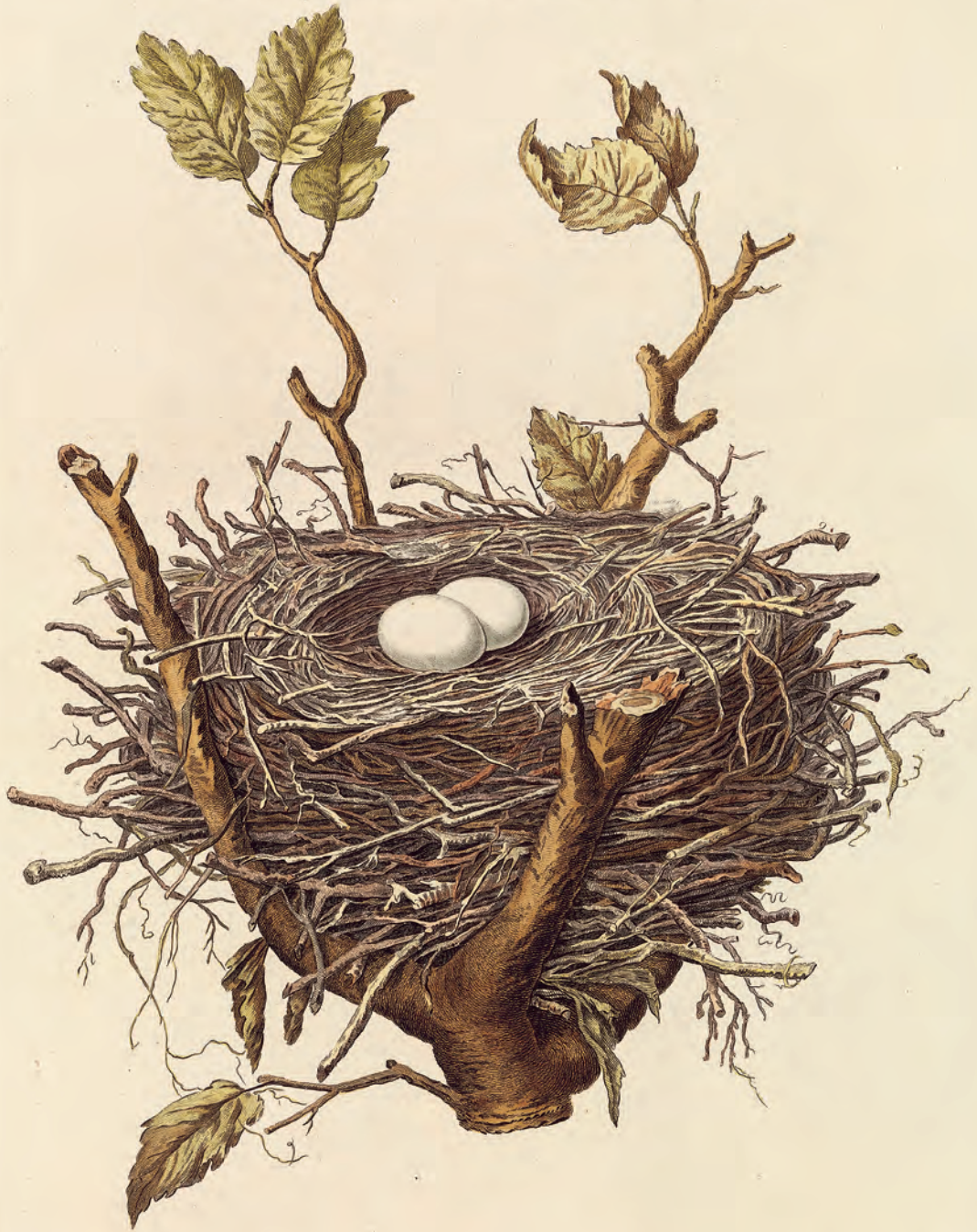
Palumbus - Bosch- of Ring-Duif Columba palumbus Linnaeus, 1758 - Houtduif