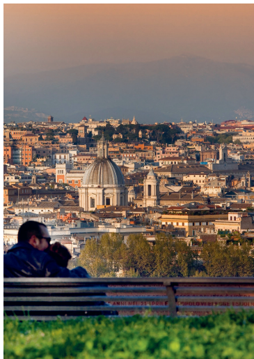
Geniet van de zonsondergang vanaf de Gianiculum.

♥ Geniet van de zonsondergang vanaf de Passeggiata del Gianicolo , terwijl u proeft van een glas wijn op een terrasje, met de Eeuwige Stad aan uw voeten... Magisch! 🍷 blz. 92.