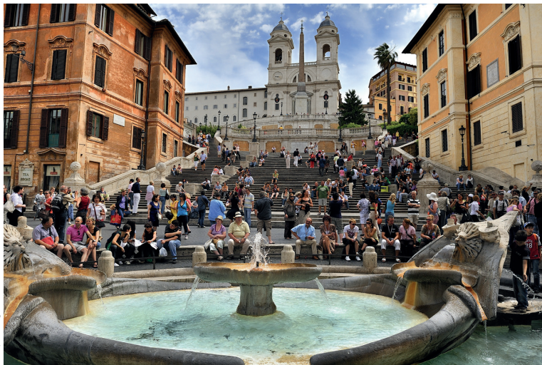
Het Piazza di Spagna en de Fontana della Barcaccia liggen aan de voet van de Trinità dei Monti.

te bewonderen in de Scuderie del Quirinale (blz. 80), die tot laat open zijn.