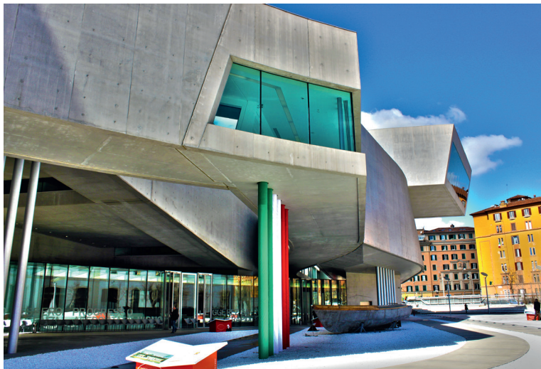
Het architectuurmuseum MAXXI is op zich al een parel van hedendaagse bouwkunst.