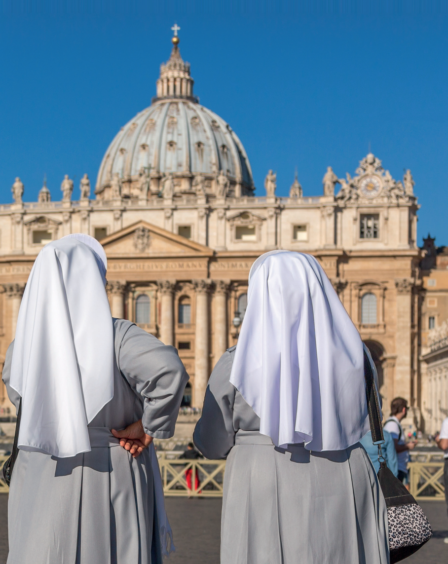
Het Sint-Pietersplein lokt veel religieuzen.