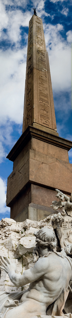
Detail van de Vierstromenfontein op het Piazza Navona.