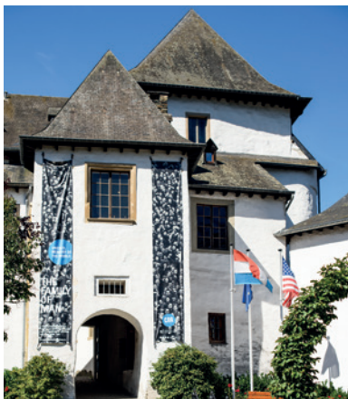
Middeleeuws kasteel van Clervaux

In deze gids wordt dus een streek besproken die zich vertakt in drie landen. Hierbij wordt geen rekening gehouden met de officiële grenzen noch met de administratieve inperkingen, want er is iets dat de Ardennen verbindt, namelijk het gevoel om tot eenzelfde land te behoren, een land waar de mens zich sinds het begin der tijden door zelfverloochening heeft geschikt in een harde omgeving, nog niet aangetast door de moderniteit, en waar karakters werden gevormd die prat gaan op moed, wilskracht, jovialiteit en verbondenheid met de oorsprong.