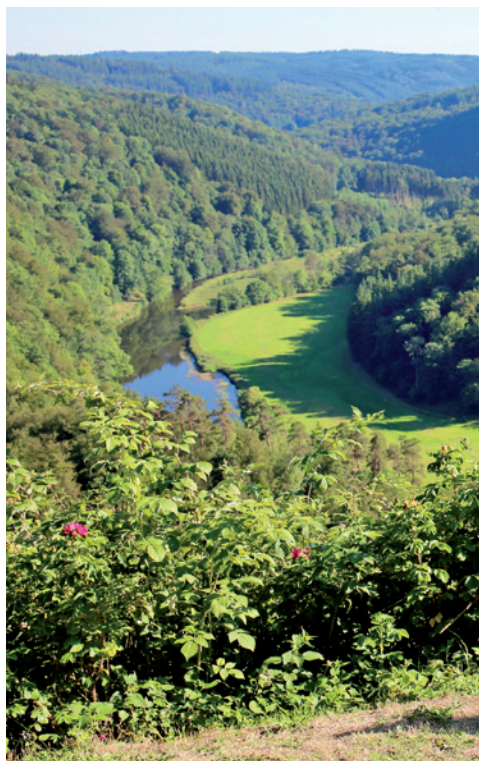
De Tombeau du Géant aan de oever van de Semois

een oud en heuvelachtig bosmassief, aan de zuidelijke en westelijke flank begrensd door de Maas en in oostelijke richting afgebakend door de Duitse Eifel. Het is soms moeilijk om de juiste omtrek ervan te bepalen, temeer daar de vele toe-eigeningspogingen van de naam voor een zekere verwarring zorgen. Gewoonlijk wordt de term 'Ardennen' gebruikt als we het hebben over de Belgische Ardennen, een streek die zich globaal gezien uitvouwt over drie provincies. 'Les Ardennes' verwijst naar een administratief departement in Frankrijk. En in ruimere zin kunnen we met de 'Ardennen' ook het toeristische geheel aanduiden dat wordt gevormd door een Frans-Belgische, ja