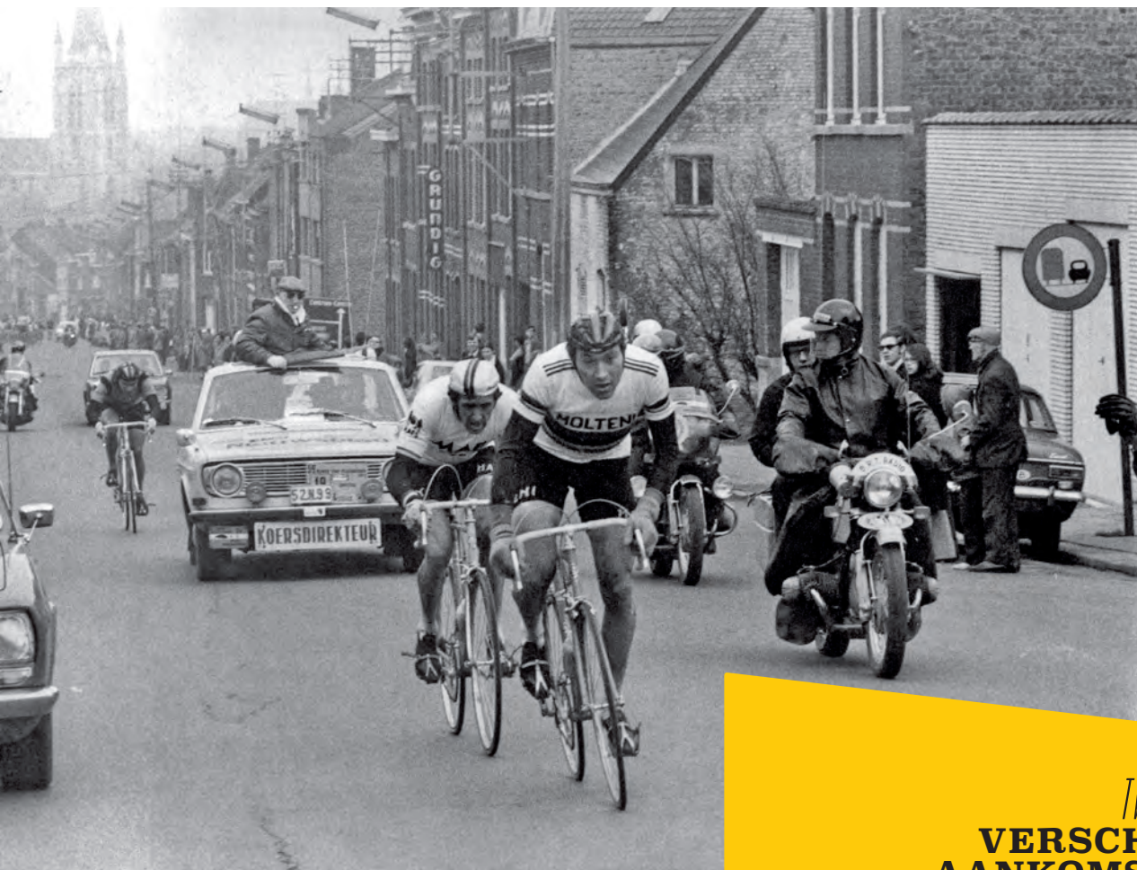
Frans Verbeeck bengelt in 1975 aan het wiel van wereldkampioen Eddy Merckx op de Kruisberg in Ronse. Dirk Baert haakt af.

Fiorenzo Magni in 1949, Eddy Merckx in 1975, Eric Vanderaerden in 1985, Edwig Van Hooydonck in 1989 en later Johan Museeuw, Fabian Cancellara, Tom Boonen, Peter Sagan ... en in 2019 de verrassende Italiaan Alberto Bettiol. Wat een erelijst.