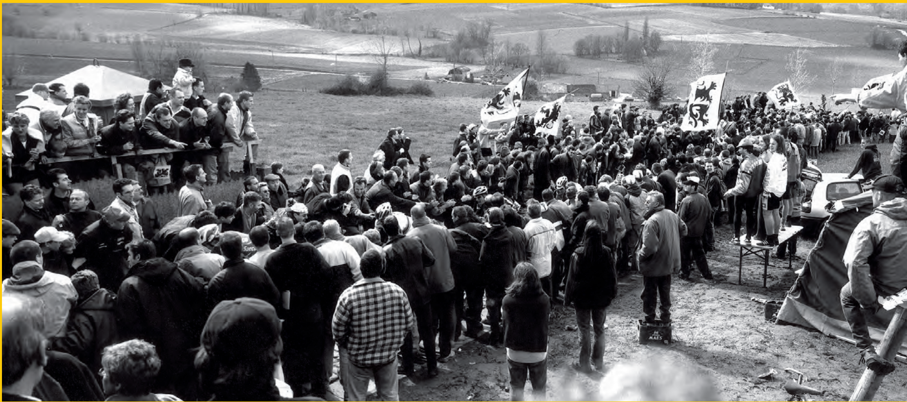
De Paterberg in 2002.