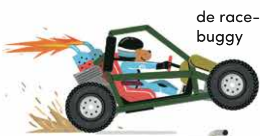
de race- buggy

De langste limousine ter wereld is 30 meter lang en heeft 26 wielen, een helikopterplatform, een jacuzzi en een waterbed.