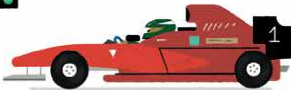
de formule 1-wagen