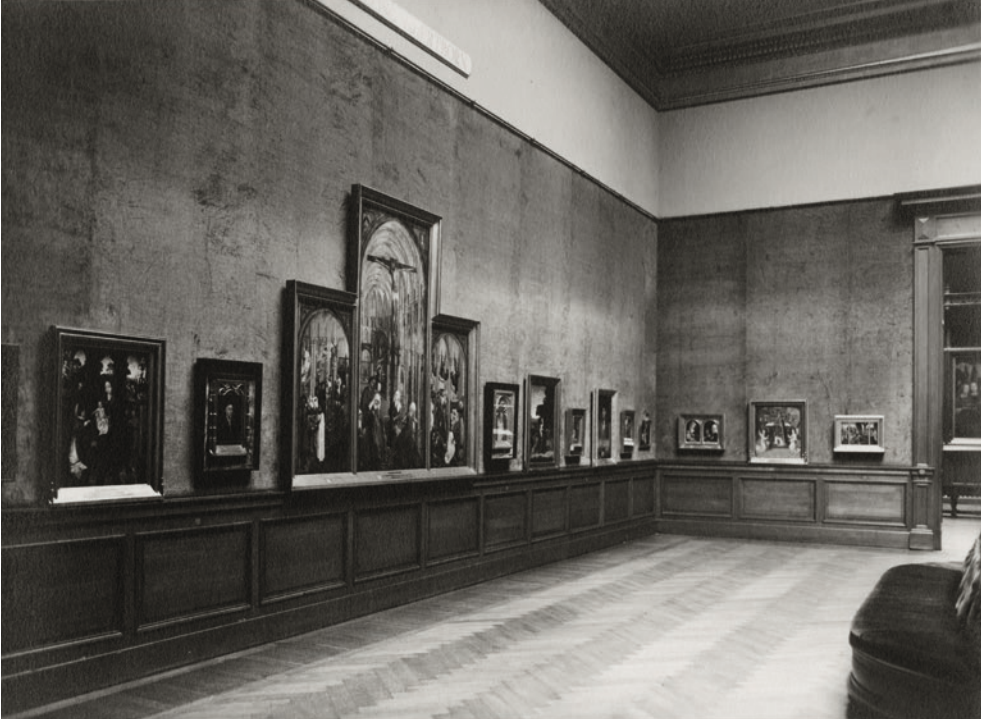
Van Ertbornzaal, Archief KMSKA