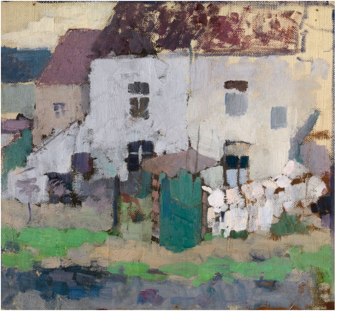
Rik Wouters, Witte gevels en tuin in Bosvoorde , KMSKA, inv.nr. 3288