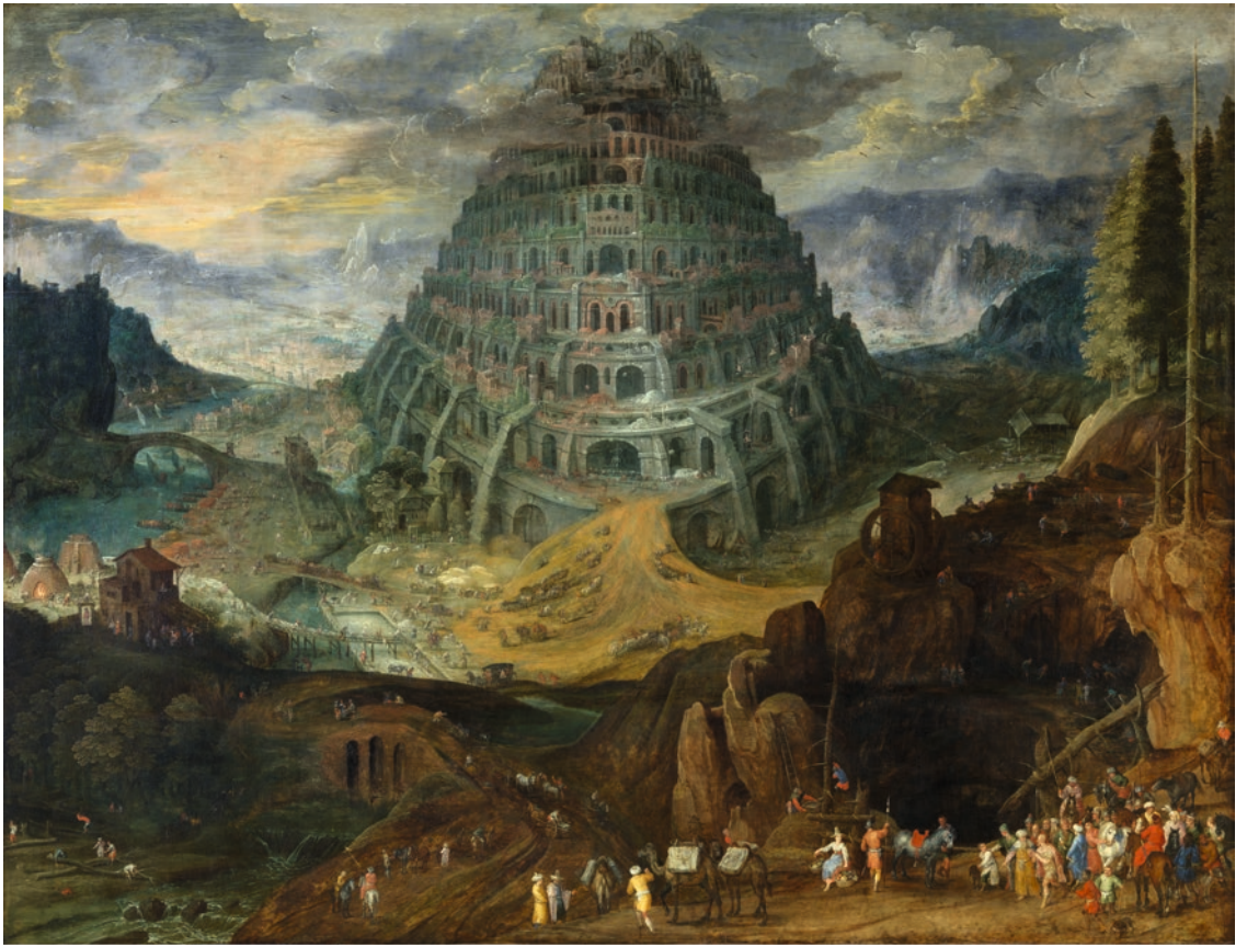
Jan Brueghel I en Tobias Verhaecht, Toren van Babel , KMSKA, inv.nr. 947