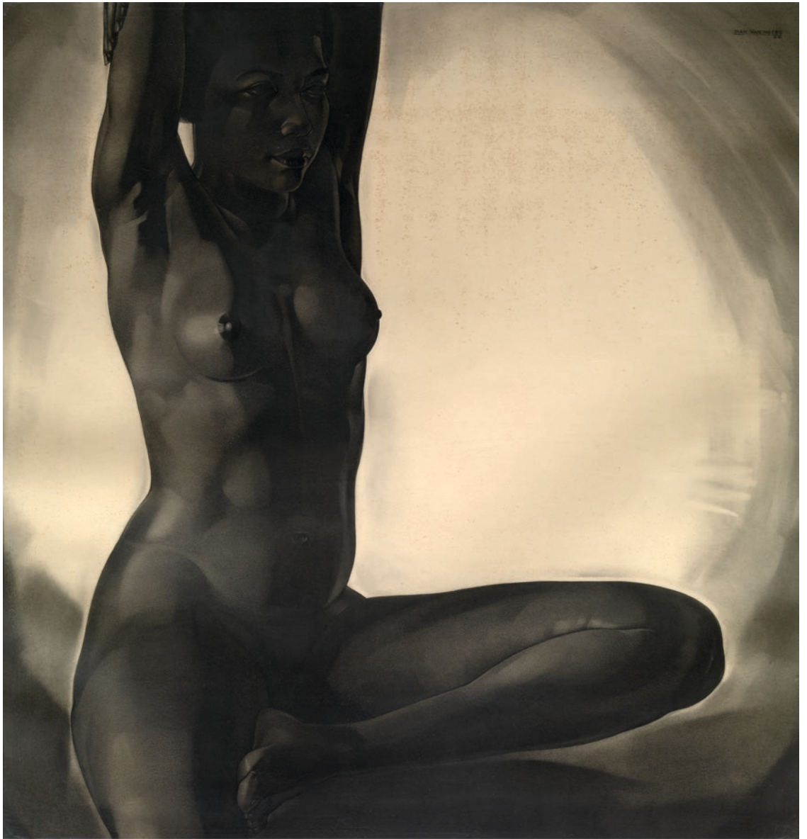
Jean Van Noten, Aïra , zonderling meisje, KMSKA, inv.nr. 2922