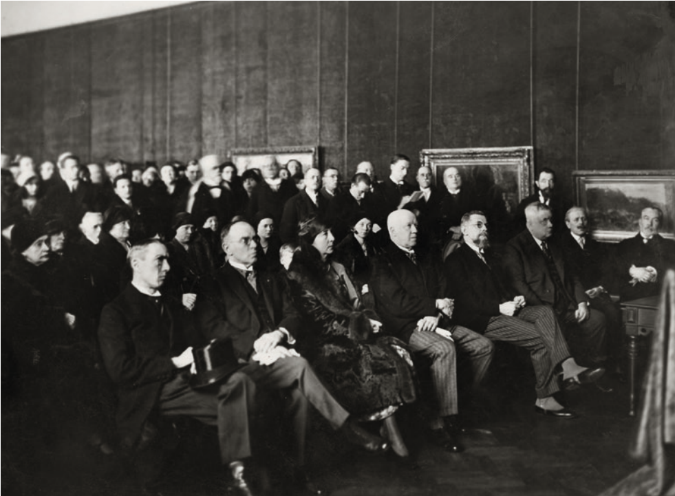
De feestrede in het museum ter gelegenheid van de opening van de Franckzaalen in 1931