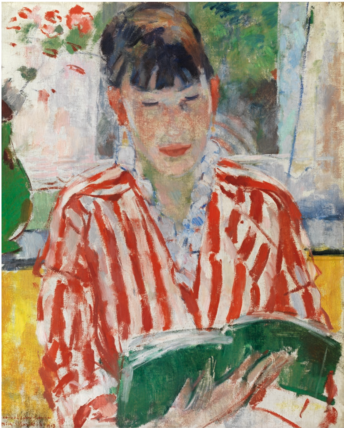
Rik Wouters, Lezende vrouw , KMSKA, inv.nr. 3292