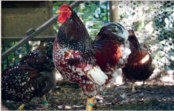
Wyandotte krielhaan roodporselein blauw- getekend