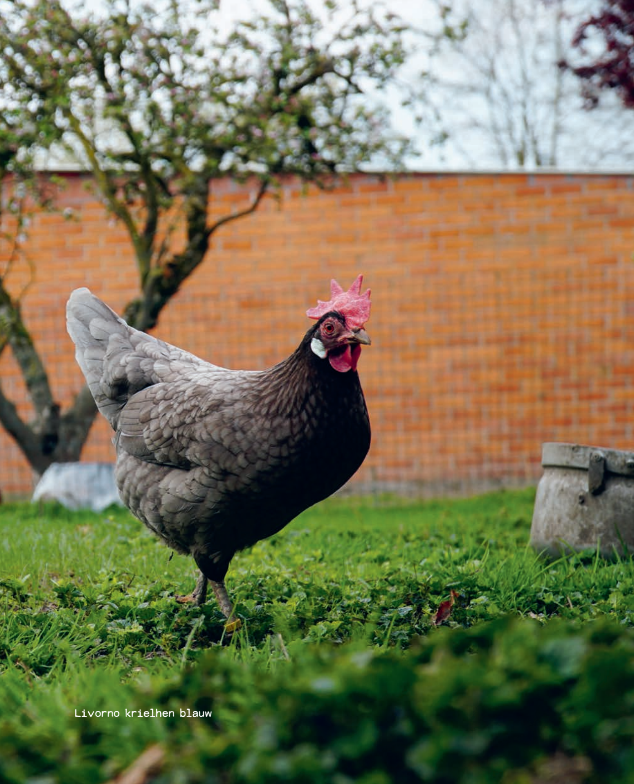
Livorno krielen blauw