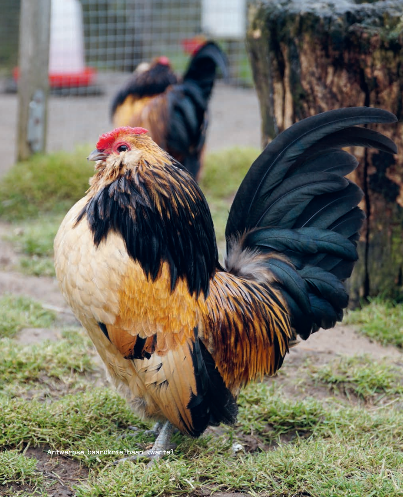
Antwerpse baardkrielhaan kwartel