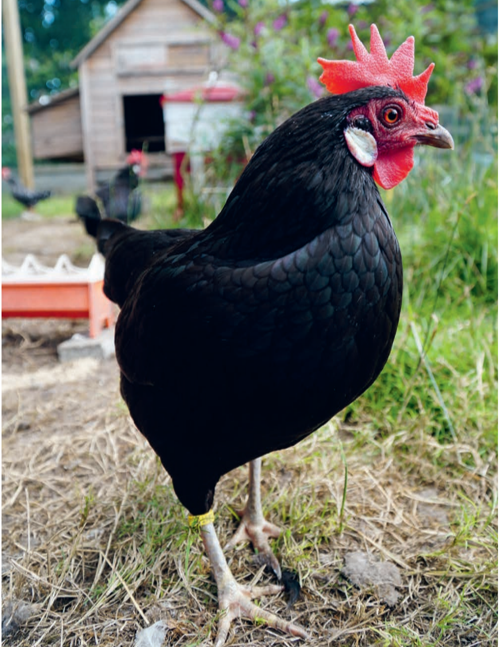
Livorno krielhen zwart