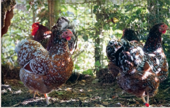
Wyandotte krielhennen: links roodporselein blauwgetekend, rechts roodporselein