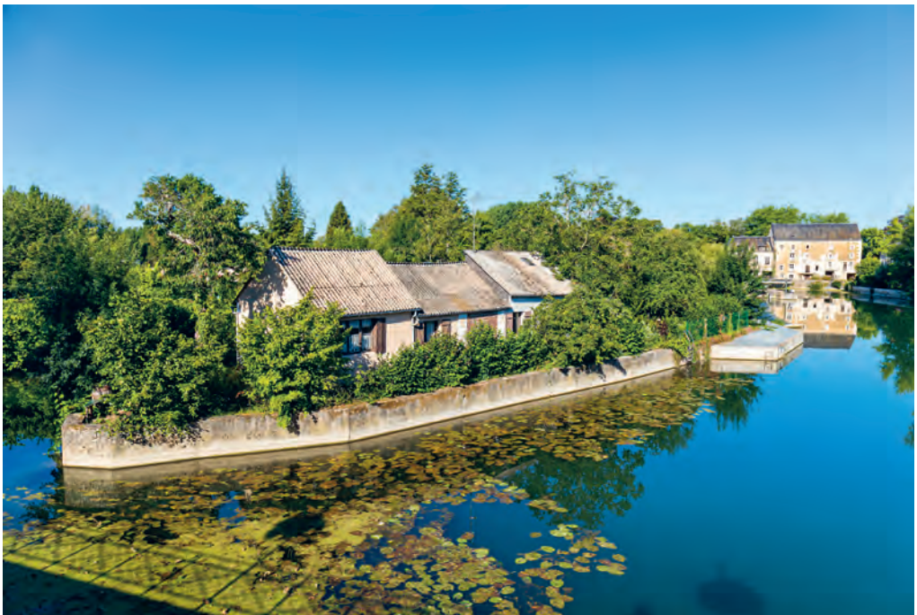
Het dorp Vaas ligt tegen de Loir genitijd.