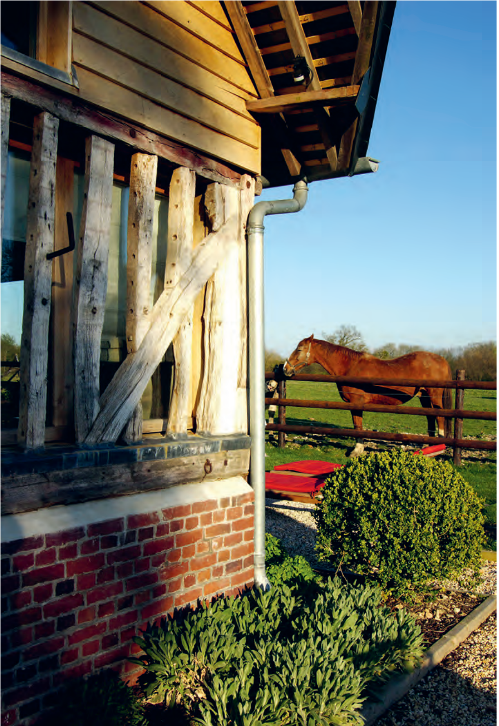
Het platteland in het Pays d'Avue is uitermate geschikt voor slow travelling.