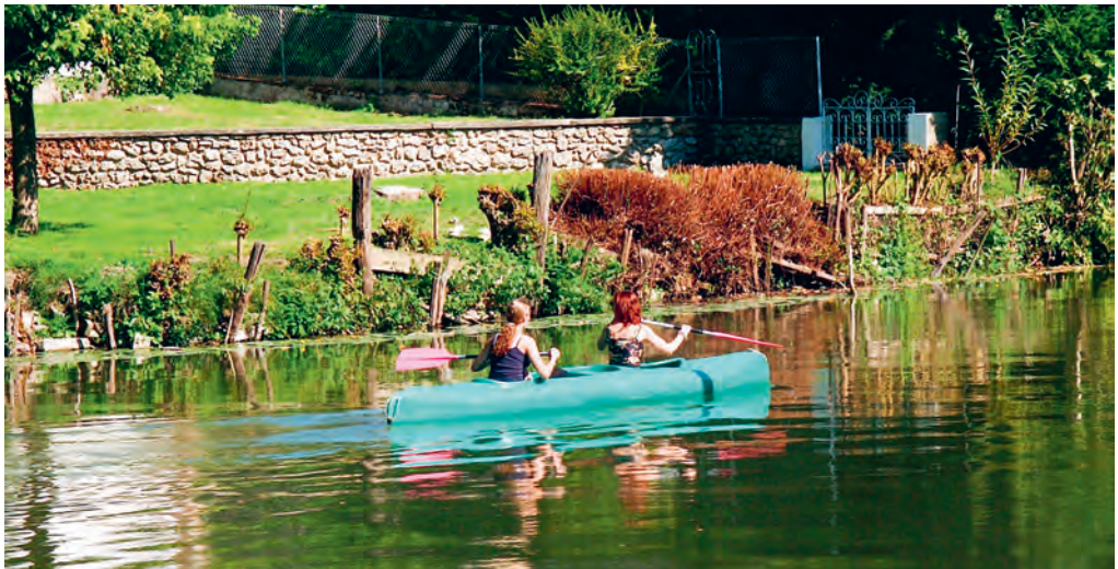
Vaar met de kano voorbij het Château du Lude.

De Loir per fiets. De Vallée du Loir is ideaal om met het hele gezin te fietsen. U vindt er meer dan 300 km aan fietspaden voor gevarieerde, aangename fietstochten. U fietst zowel langs de rivier, tussen wijngaarden als door bossen. Er zijn in totaal zeven bewegwijzerde, lusvormige fietsroutes van 16 tot 50 km, allemaal