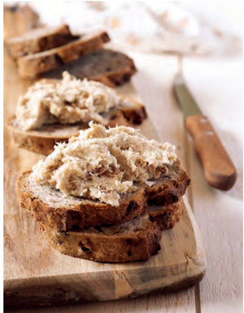
Proef bij een glas lokale wijn de lekkere rillettes.

Beaumont-sur-Dême: restaurant en delicatessenzaak Les Mères Cocottes. Deze delicatessenzaak lijkt wel een teletijdmachine die u mee terug in de tijd neemt, want de schappen liggen vol etenswaren van vroeger.