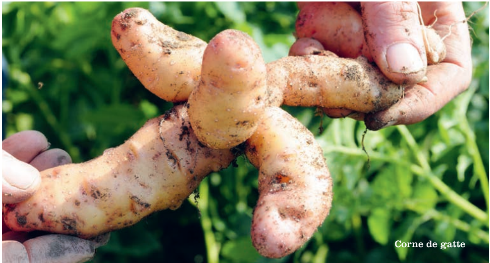
Corne de gatte