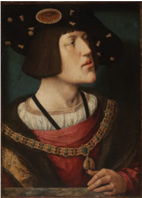
Keizer Karel V met de ketting van de Orde van het Gulden Vlies. Barend van Orley, Portret van Keizer Karel V , ca. 1515–1516. (Museum van Schone Kunsten, Boedapest)

Andere auteurs zouden zonder twijfel andere voorwerpen hebben geselecteerd, op enkele na. De redactie koos als eerste selectie criterium voor duurzame objecten die één persoon zelf kan dragen – dus geen auto’s, gebouwen, bederfbare goederen of grote schilderijen. Die beperking doet niet tekort aan de inhoud van dit boek. Bovendien komen auto’s, gebouwen, bederfbare goederen of grote schilderijen al ruim aan bod in de geschiedenis van de techniek, architectuur, voeding of kunst. De honderd voorwerpen zijn van steen, hout, papier, plastic, ijzer, textiel, bakeliet, latex, koper, glas en één is zelfs een virtueel voorwerp. Ze vormen een mooi staal van het vernuft waarmee de mens dingen vervaardigd heeft.