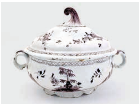
Soepterrine met krulvormige handvaten en een dekselknop in mangaanpaars camaïeu. Oosterse voorstelling van rotsformatie met bomen en bloemen, 18de eeuw. (STAM, Gent, inv. 12032 – www.artinflanders.be – publiek domein)

bezittingen, gerei, tuigen...) verrijkt immers het historisch onderzoek door, letterlijk, een ruimtelijke en stoffelijke dimensie toe te voegen die op geen andere manier verschijnt. Twee voorbeelden illustreren dat. Vesalius vernieuwde de kennis van het menselijk lichaam in zijn zevendelige werk De humani corporis fabrica (1543). Het boek bevatte papieren modellen van het lichaam die je tot kleine, driedimensionale pop-upfiguurtjes kon plooiën. Die ingenieuze vondst toonde uitstekend de complexiteit aan van het menselijk lichaam, beter dan welke eendimensionale tekening ook. In april 1915 gebruikte het Duitse leger