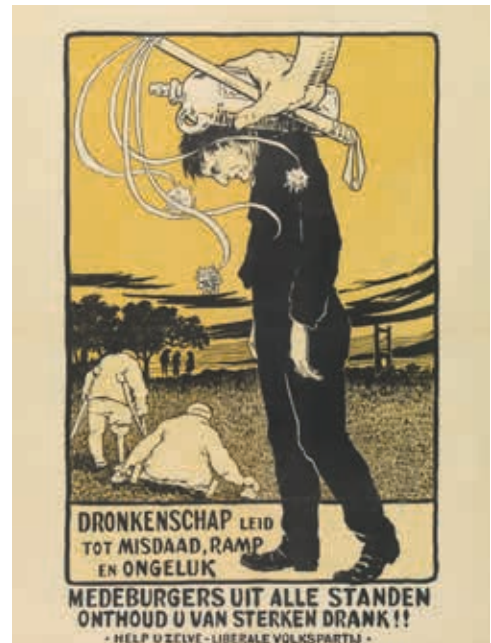
De jeneverstoop als last op de schouders van de consument. Affiche Dronkenschap ontworpen door Florimond Van Acker (1858–1940) en uitgegeven door de Liberale Volkspartij, Antwerpen, ca. 1900–1910.

Beperkingen in de tijd zijn er niet. Het eerste object stamt uit het paleolithicum, het laatste uit de 21ste eeuw. De voorwerpen zijn chronologisch gerangschikt. Sommige objecten konden precies gedateerd worden, maar voor andere kon dat niet en in dat