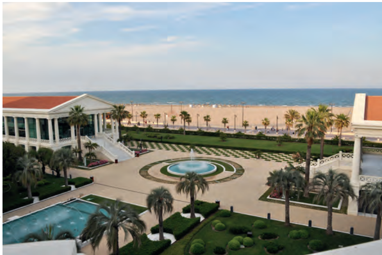
Genieten van een frisse duik kan aan de Playa de las Arenas.

Bezichtig de barracas met de daken van stro en verken het gebied aan boord van een albuferenc , nadat u in El Palmar paling all i pebre hebt gegeten.