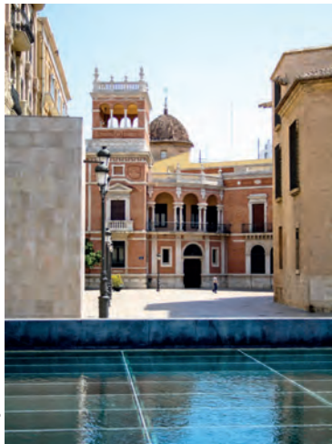
De tentoongestelde stukken in La Almoina gaan terug tot het ontstaan van de stad in 138 v.Chr.

♥ Het natuurgebied La Albufera verkennen: ongerept landschap waar land en water zich vermengen.