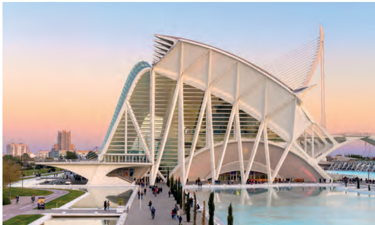
Museo de las Ciencias Príncipe Felipe, een ontwerp van Santiago Calatrava

Dit futuristische gebouw in de vorm van een menselijk oog staat symbool voor de toegang tot de wereld. Het was het eerste gebouw in de Stad van de Kunst en de Wetenschap (in 1998). Het staat midden in een waterbekken van 24.000 m 2 en omvat een planetarium , een bioscoop voor OMNIMAX-films, en een 'laserium' waar een audiovisueel spektakel wordt getoond op een scherm van 900 m 2 .