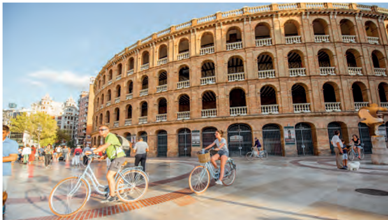
Aan de Plaza de Toros staat de enorme arena. Er worden geregeld corrido's georganiseerd waar lokale torero's mogen aantreden.

Adresgegevens van de luchthaven, blz. 3.