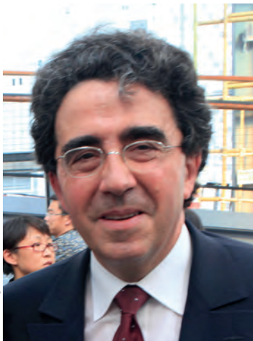
Architect Santiago Calatrava

een schrijver van feuilletons, maar later brak voor hem een bloeiende literaire carrière aan waarin hij schreef