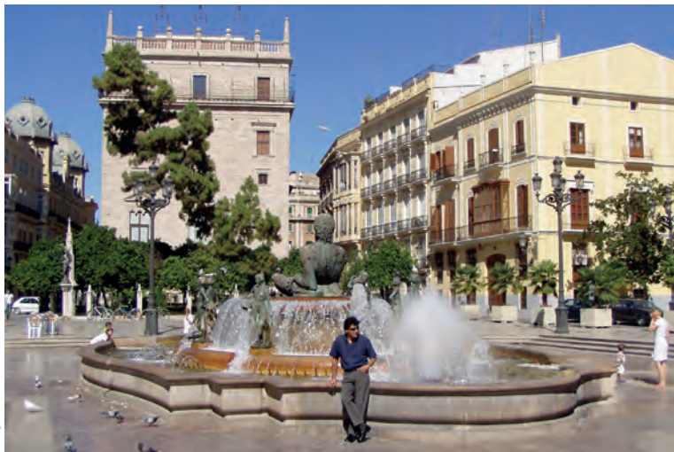
Aan de Plaza de la Virgen staat o.a. het fraaie gotische Palau de la Generalitat Valenciana.