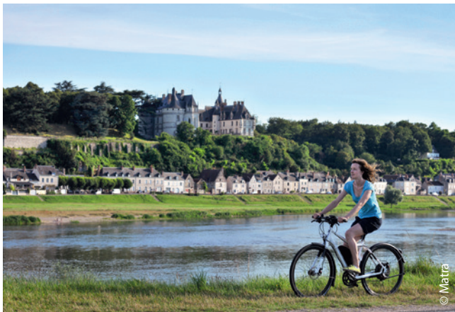
Van Blois naar Tours

Pas op: sommige bruggen over de Loire zijn erg smal en niet ingericht op fietsers. Ze hebben geen afzonderlijke rijstroken of fietspaden. Om veilig over te steken is het dan beter het trottoir te nemen en je fiets aan de hand te houden. We geven je tips over hoe je gevaarlijke punten veilig kunt oversteken.