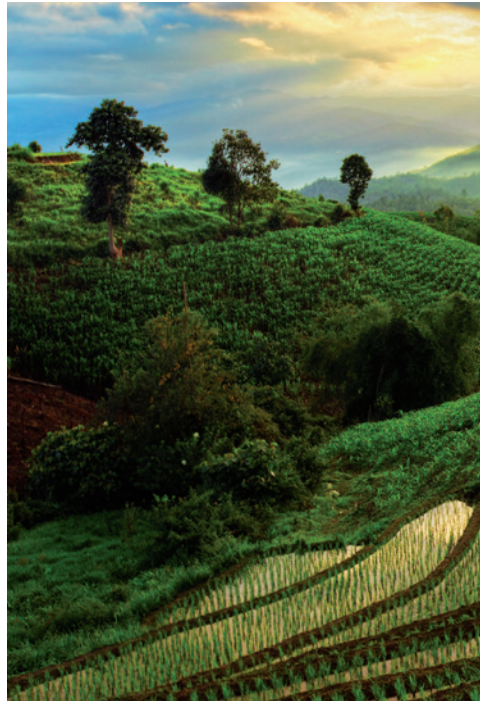
Rijstvelden in Chiang Mai

Helaas heeft de toeristenstroom en het vaak daaruit voortvloeiende winstbejag hier en daar afbreuk gedaan aan de beminnelijkheid van de Thai en ook geleid tot andere, rampzalige situaties: vernielde kuststroken, de transformatie van heel speciale plekjes in toeristengotto's, overbevolkte eilanden, enzovoort.