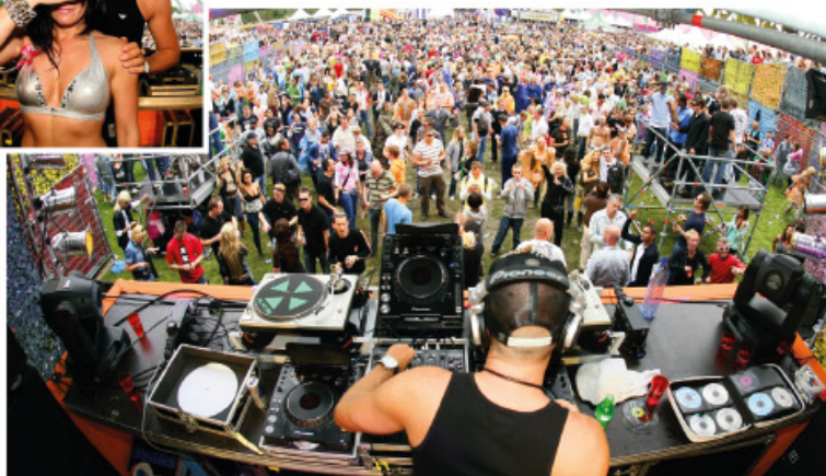
Madhouse Stage, Dance Valley 2008.