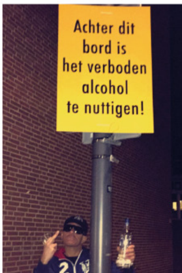
De rebel himself in full effect.