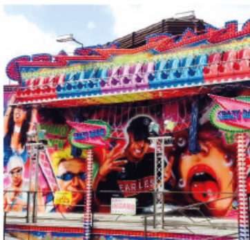
Ik als kermisattractie.