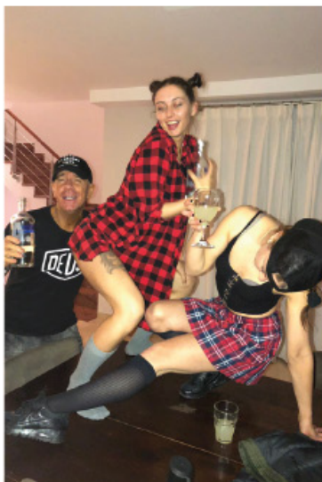
Opnames videoclip Gucci Lovers in Marbella, 2018.