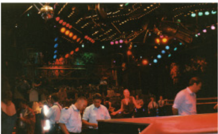
Politie doorzoekt de dansvloer van de iT.