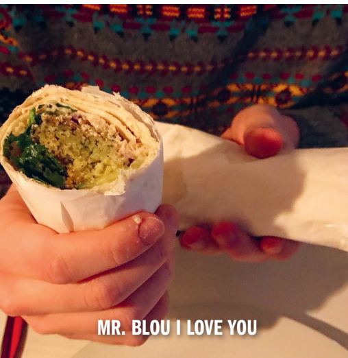
MR. BLOU I LOVE YOU