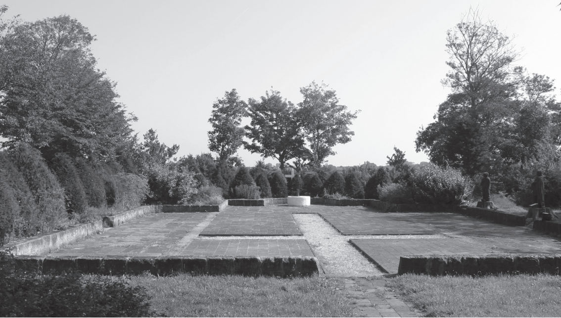
De Adalbertusput in de voormalige twaalfde-eeuwse kerk, op de plaats van de kapel in de duinen.

gebracht worden. Een vermelding uit de tiende eeuw van een kapel in Egmond met ‘alles eromheen’ doet vermoeden dat we hier met een complete nederzetting te maken hebben. 13