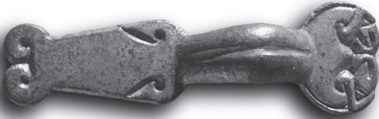
Domburg- fibula als voorbeeld van de Friese identiteit?

Toch suggereren archeologische vondsten een etnische eenheid. Zo lijken Domburg- fibulae , een bepaald type mantelspelden dat langs heel de Nederlandse kust en in een deel van het Midden-Nederlandse rivierengebied is gevonden, een mooi voorbeeld van de Friese identiteit te vormen.