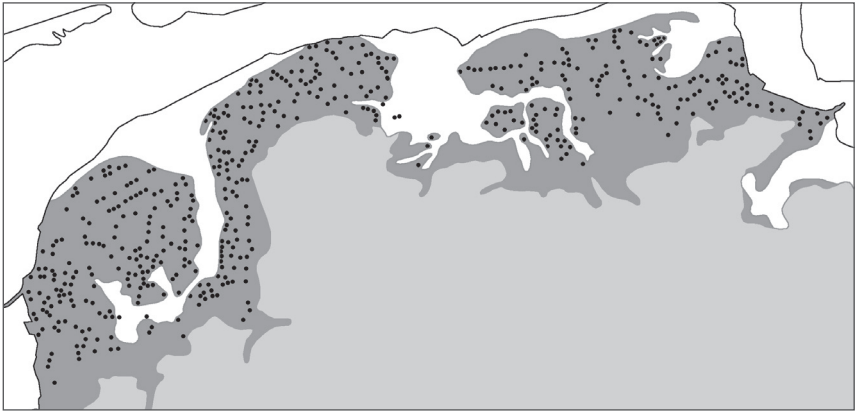
Verspreiding van terpen in het Fries-Groningse kweldergebied.

meer en steeds hogere stormvloed. Door voortdurende erosie als gevolg van getijdenwerking ontwikkelden zich zeearmen zoals de Lauwers en de Middelzee in de huidige provincies Groningen en Friesland. De regelmatige wateroverlast noopte de bewoners hun huisterpen op te hogen. Vaak werden deze uitgebreid om plaats te bieden aan meerdere gebouwen, soms aan hele nederzettingen. In enkele gevallen verrees er een conglomeraat van terpen, zoals op de plaats waar Leeuwarden zou ontstaan. Alleen al in de provincie Friesland zijn honderden terpen bekend.