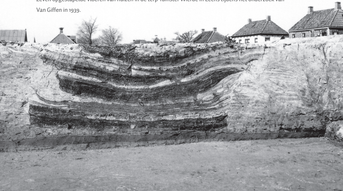
Zeven opgestapelde vloeren van huizen in de terp Tuinster Wierde in Leens tijdens het onderzoek van Van Giffen in 1939.

Wanneer terpen bij hoogwater wekenlang door de zee werden omsloten, was het gebrek aan drinkwater voor mens en vee een nijpend probleem. Daarom vinden we naast de gebruikelijke afvalkuilen en putten ook grote komvormige drinkwaterkuilen waarin regenwater werd opgevangen. Dergelijke kuilen worden 'dobben' genoemd. De Romeinse schrijver Plinius maakte in de eerste eeuw van onze jaartelling al melding van kuilen waarin de terpbewoners water opvingen.