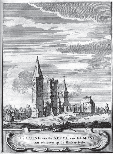
De abdij van Egmond, gravure uit Kronyk van Egmond van Jan van Leyden uit 1732.

we als heidense cultusplaatsen kunnen beschouwen, maar door de Franken door stichting van kerken gekerstend werden. Mogelijk was er binnen dit centrale-plaats-complex een edelsmid actief. In het naburige Limmen-De Krocht werden daarvoor aanwijzingen gevonden. Het voorkomen van het toponiem Smithan in deze omgeving – de exacte plaats is onbekend – versterkt dit vermoeden.