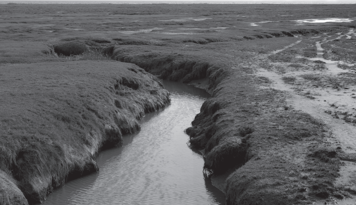
Zeewater zorgt voor een zilte kweldervegetatie.

Op de hoogste delen van het natuurlijke reliëf, zoals op kwelderwallen, ontstonden nederzettingen die aanvankelijk slechts uit een enkele boerderij en misschien wat bijgebouwen bestonden, maar in de loop van de tijd met meerdere boerderijen uitgebreid werden. Daar kon naast veeteelt op beperkte schaal landbouw bedreven worden met gewassen die niet gevoelig waren voor de zilte bodem. Voorwaarde daarvoor was wel dat de akkers niet gedurende het groeiseizoen onderliepen.