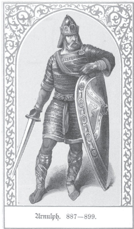
Keizer Arnulf van Karinthië.

Vier jaar na de dood van Godfried de Deen werd de nieuwe politieke situatie in Frisia bevestigd door een schenking van koning Arnulf van Karinthië, die Karel de Dikke in 887 had afgezet. Gerulf kreeg uitgestrekte goederen binnen zijn graafschap formeel in eigendom. 18 De schenking werd op 9 augustus 889 in Frankfurt vastgelegd in de eerste van de vier zogenaamde koningsoorkonden. Dit waren documenten betreffende de overdracht