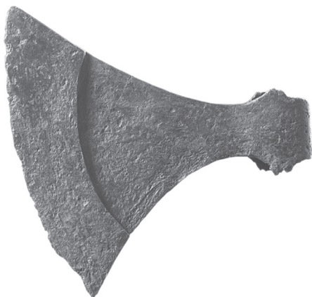
Kop van een Deense strijdbijl uit de elfde of twaalfde eeuw.