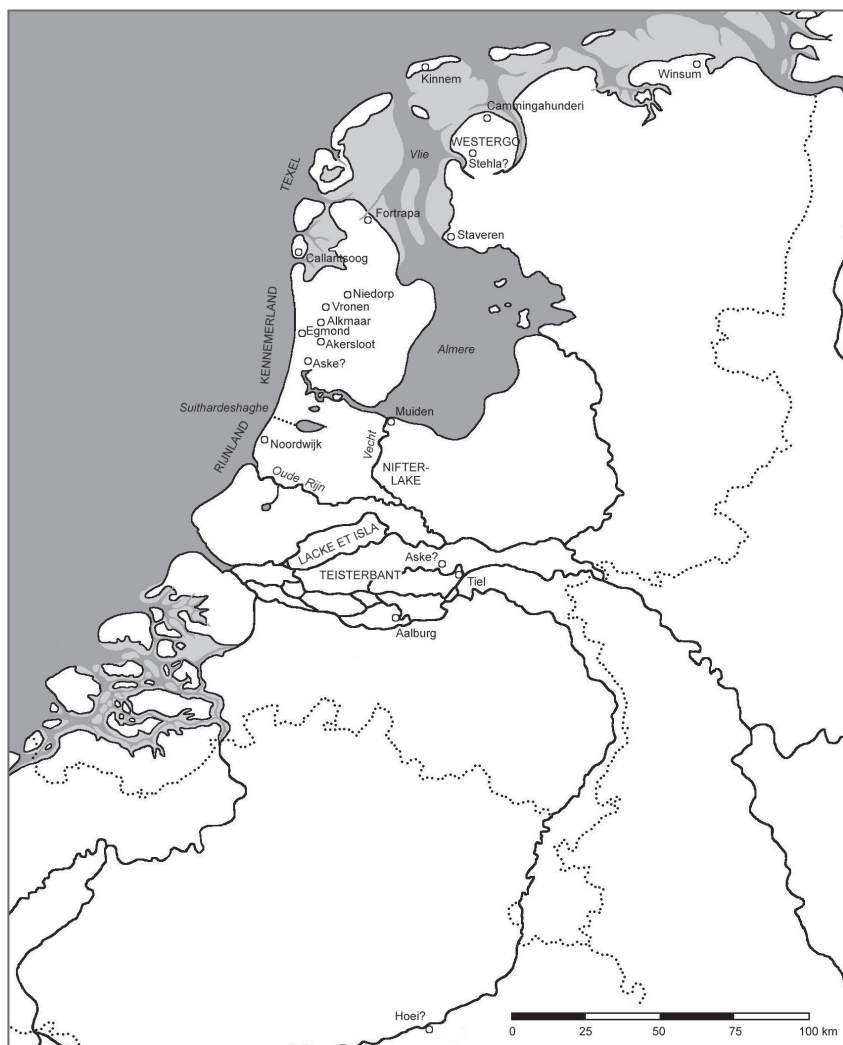
De bezittingen van de eerste Gerulfingen: Gerulf I (Westergo), Gerulf II (Rijnland, Teisterbant en Hoei), Dirk I (Kennemerland en Texel tot Kinnem) en Waldger (Teisterbant, Lacke et Isla, Nifterlake). De vermoedelijke bezittingen van Gardulf (Staveren, Winsum) zijn ook op de kaart aangegeven.

door de Frankische vorsten van goederen in West-Frisia aan de Gerulfinger graven. De koningsoorkonden van 923, 969 en 985 zullen hierna nog ter sprake komen.