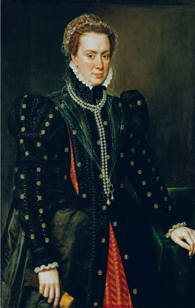
Margaretha van Oostenrijk (1522-1586), hertogin van Parma en Piacenza. Olieverf op doek, A. Mor, 1562 (Gemäldegalerie, Berlijn).

De aftocht van de kardinaal zorgde er niet alleen voor dat de hoge adel weer een grotere stem kreeg, maar tevens dat de gelederen van de hierdoor bemoedigde calvinisten werden versterkt. Velen in de Lage Landen, ook de nog steeds overgrote meerderheid van katholieken, keurden al te hardvochtig optreden tegen hervormingsgezinden af. De Prins van Oranje sprak zich er