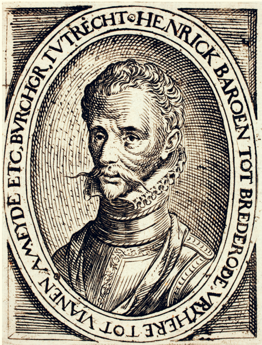
Hendrik van Brederode (1531-1568). Illustratie in: P.C. Bor, Oorspronck, begin ende vervolgh der Nederlandsche oorlogen , deel 1, Leiden/Amsterdam, zeventiende eeuw (Bibliotheek Vredespaleis, Den Haag).

De reactie in de Nederlanden op de koninklijke 'brieven uit het bos van Segovia' was dramatisch. De markies van Bergen en de Prins van Oranje wilden hun publieke ambten uit protest neerleggen, en andere hoge edelen distantiëerden zich eveneens van het koninklijk bestuur. De landvoogdes verzocht allen met nadruk om toch vooral aan te blijven. Onder leiding van Hendrik van Brederode en Lodewijk van Nassau, een broer van Willem van Oranje, keerden ruim 400 meest lagere edelen zich in een 'Compromis' (of 'Eedverbond') tegen de inquisitie en maatregelen tegen ketterij, vervat in regeringsordinanties, de zogenoemde 'plakkaten'. Het Eedverbond telde een aantal protestanten, onder wie de voornaamste leiders Brederode en Lodewijk van Nassau, maar de meerderheid was rooms-katholiek.