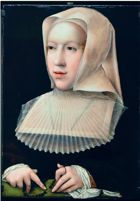
Margaretha van Oostenrijk (1480-1530), hertogin van Savoye. Olieverf op paneel, Bernard van Orley, zestiende eeuw (Monastère royal de Brou).

zelf te regeren, dus zijn vader Maximiliaan trad op als regent. Maximiliaan en de vorsten die na hem regeerden, maakten de Nederlanden tot onderdeel van hun grotere Habsburgse bezit. Internationale en dynastieke belangen kregen voorrang. In 1494 droeg Maximiliaan, inmiddels keizer van het 'Heilige Roomse Rijk', het bestuur over de Nederlanden over aan Filips de Schone. Die trouwde in 1496 met Johanna, dochter en erfopvolgster van de 'Katholieke Koningen' Ferdinand en Isabella van Aragon en Castilië. Zo ontstond de connectie met Spanje. Filips de Schone werd in 1506 koning van Castilië maar overleed datzelfde jaar. Keizer Maximiliaan trad weer op als regent, nu voor Filips' zoon Karel, en Maximiliaans dochter Margaretha werd landvoogdes. Het op de Habsburgse belangen gerichte bestuur van Maximiliaan en Margaretha riep weerstand op, en de Nederlandse gewestelijke vertegenwoordigers reageerden opgelucht toen de jonge Karel in 1515 meerderjarig werd verklaard. Karel ging even later ook regeren als koning van Spanje, en in