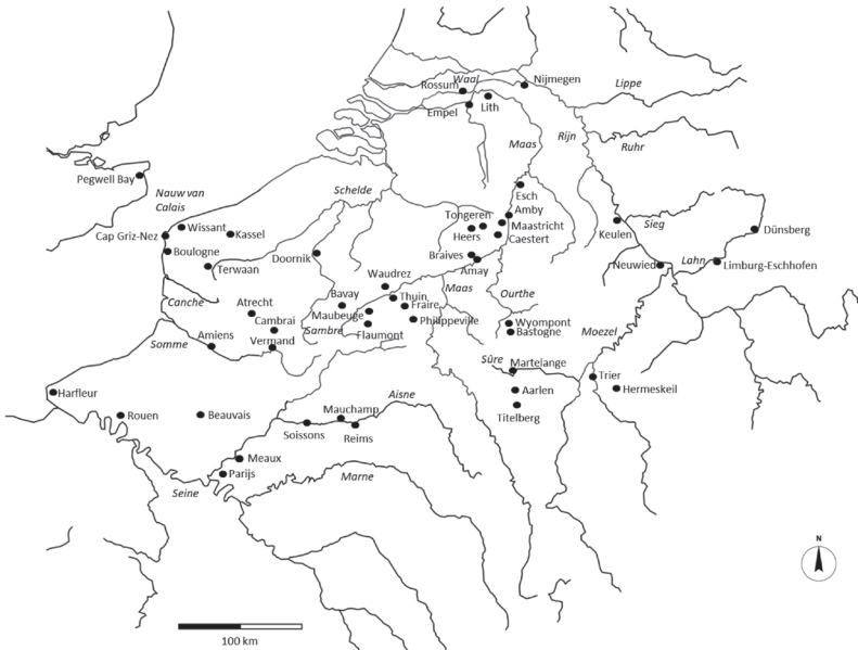
Kaart 1: De in dit boek genoemde plaatsnamen.

Caesar schrijft in de eerste alinea van zijn oorlogsverslag dat Gallië uit drie delen bestaat, waarvan het land van de Belgae er één is. Belgica verwijst in dit boek naar het gebied tussen de Rijn en de Noordzee, met als kern het zuidelijk deel van de Benelux, maar ook aangrenzende stukken in Noord-Frankrijk en het westen van Duitsland (kaart 1 en 2). Ter afwisseling zal ook van ‘de Lage Landen’ en het ‘noorden’ worden gesproken. Het noemen van de Belgae was voor Caesar een versimpeling die hij nodig had om uit te leggen waarom hij zijn mandaat voor de Gallische oorlog oprekte tot aan de Rijn. Caesar zal hebben inge-