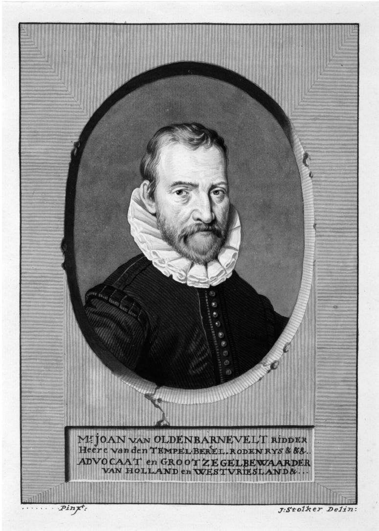
Johan van Oldenbarnevelt.