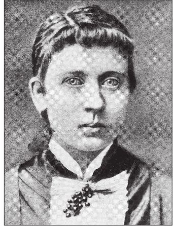
Klara Hitler, geb. Pözl

Alois beslist dat zijn zoon ambtenaar dient te worden en hij stuurt hem na vijf