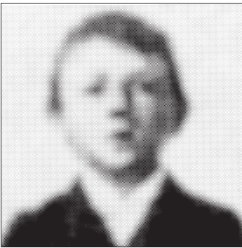
Hitler als leerling van de lagere school in Leonding