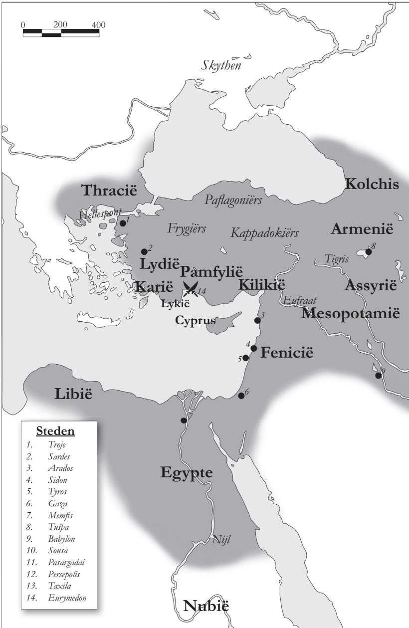
Het Perzische Rijk ten tijde van Darius