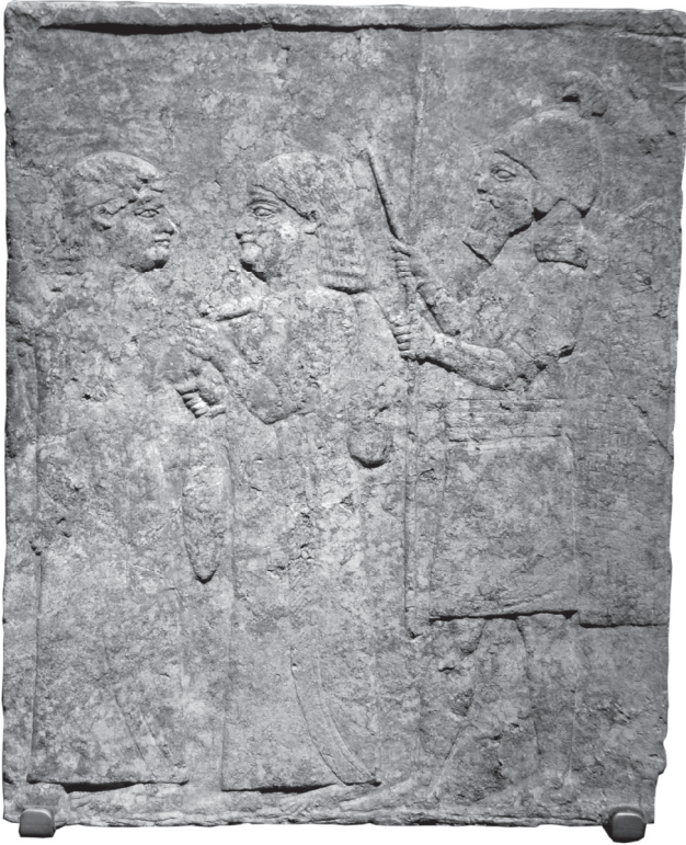
Deportatie van een bevolking. Dit reliëf uit het Rijksmuseum van Oudheden in Leiden is Assyrisch, maar de praktijk kwam ook voor in het Perzische Rijk.

verbonden met de aristocratische families wier macht Darius had gebroken. Om te verhinderen dat een van die families een concurrerend machtscentrum zou worden, koos Darius als opvolger Xerxes, zoon van een vrouw zonder machtige verwanten. 5 Ook na Darius' zesendertigjarige heerschappij was de macht van de koning over de aristocraten nog niet vanzelfsprekend. De nieuwe koning moest opstanden in Egypte (487-485) en Babyloonië (484) onderdrukken. In 480 was hij echter sterk genoeg om net als Cyrus, Kambyses en Darius een buitenlandse expeditie te organiseren. Het voornaamste verslag van de Xerxes' invasie van Griekenland is geschreven door de Griekse onderzoeker Herodotos.