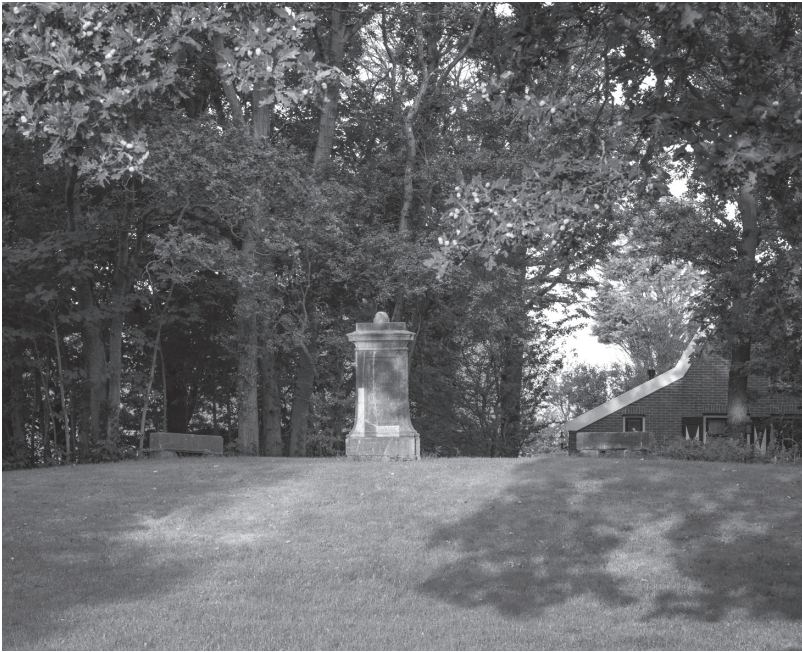
Het 'huldtoneel' op de Schepelenberg te Heemskerk, de traditionele gerechtsplaats van het graafschap Holland. Foto Paul Beentjes, 2016.

zijn hof vervulden. In ruil kregen ze stukken van het graafschap in leen om in hun levensonderhoud te voorzien. Tegelijk waren zij dan heer over de inwoners en behandelden zij de rechtszaken op een lager niveau. Dikwijls dienden die adviseurs hun heer ook als bewa- pend ruiter. Ze vormden eigenlijk de kern van zijn leger. Na het jaar 1000 vormden zij een eigen stand, die zich langzaam tot onderste trap van de adel ontwikkelde. Ze werden ridders genoemd omdat ze op paarden reden en vochten (ridder = rijder = ruiter) en hun stand heette de ridderschap.