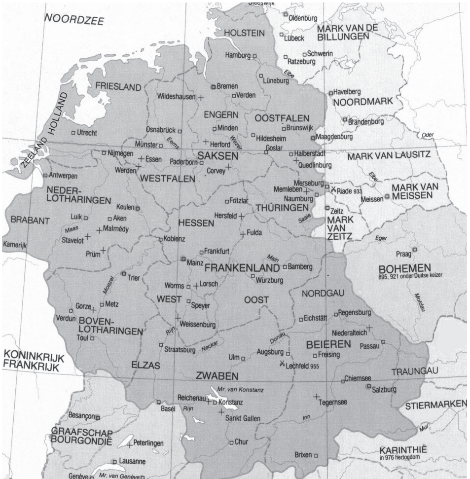
Het Duitse Rijk in de tiende eeuw. Detail uit: Donald Matthew, Atlas van de middeleeuwen (Amsterdam/Brussel 1985) 80.