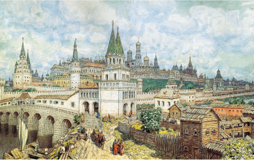
Moskou in de zeventiende eeuw.

onderwijs dat hij genoot stelde naar West-Europese maatstaven niet zo veel voor, maar was niettemin aanzienlijk beter dan dat van de gemiddelde Russische edelman. Voor geleerde was Peter niet in de wieg gelegd, maar hij was wel reuze nieuwsgierig, praktisch van aard en stond open voor nieuwe vindingen en inzichten. Aan dit rustige en beschermde leventje kwam plotseling een einde toen in 1682 tsaar Fjodor III overleed; hij was nog geen 21 jaar oud.