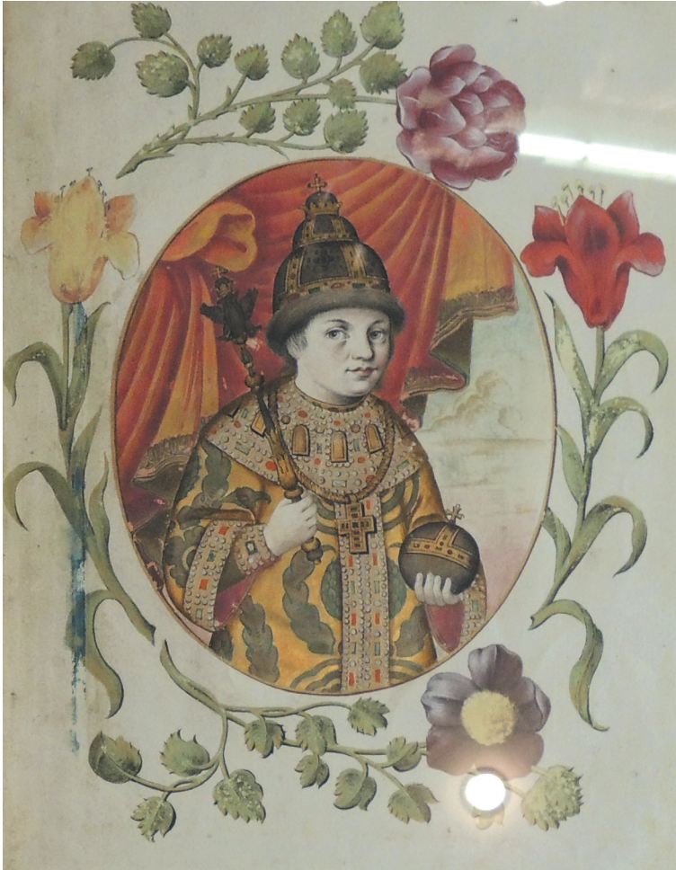
Peter als kind.

de streltsy hun moordlust bot op tal van hovelingen, onder wie vooral leden van de Naryskjin-clan. Tot de slachtoffers behoorden ook twee broers van Natalja.