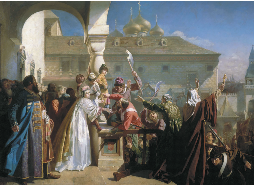
Opstand van de streltsy: Natalja bewijst dat tsarevitsj Ivan niet door haar vermoord is. Schilderij van Nikolai Dmitriev-Orenburgsky (1838-1898).

er aan het hof stemmen opgingen om Peter de troon te laten bestijgen. Veel bojaren hadden inmiddels hun buik vol van de kliek rond Miloslavski, maar dit kamp hamerde erop dat Ivan de rechtmatige opvolger was. In het heftige debat dat losbarstte werd op zeker moment geroepen dat dan 'het volk' maar moest beslissen. Normaal gesproken betekende dit dat er een Zemski Sobor – een Vergadering van het Land – bijeengeroepen moest worden, waar edellieden, kooplieden en stedelingen uit alle delen van het rijk de nieuwe tsaar kozen. Het was op deze manier