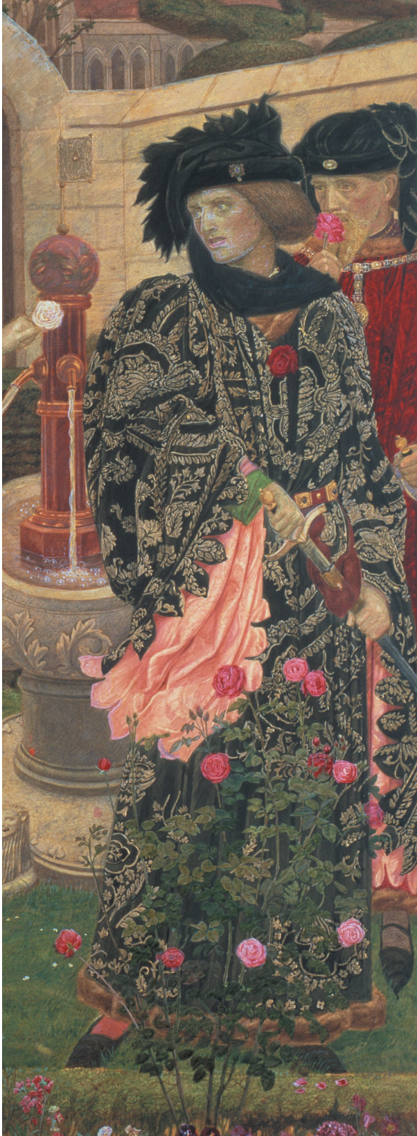
Scène uit Shakespeares Henry VI , deel 1: leden van de huizen York en Lancaster plukken ieder rozen die bij hun factie horen. Geschild- derd door Henry Payne, circa 1908.