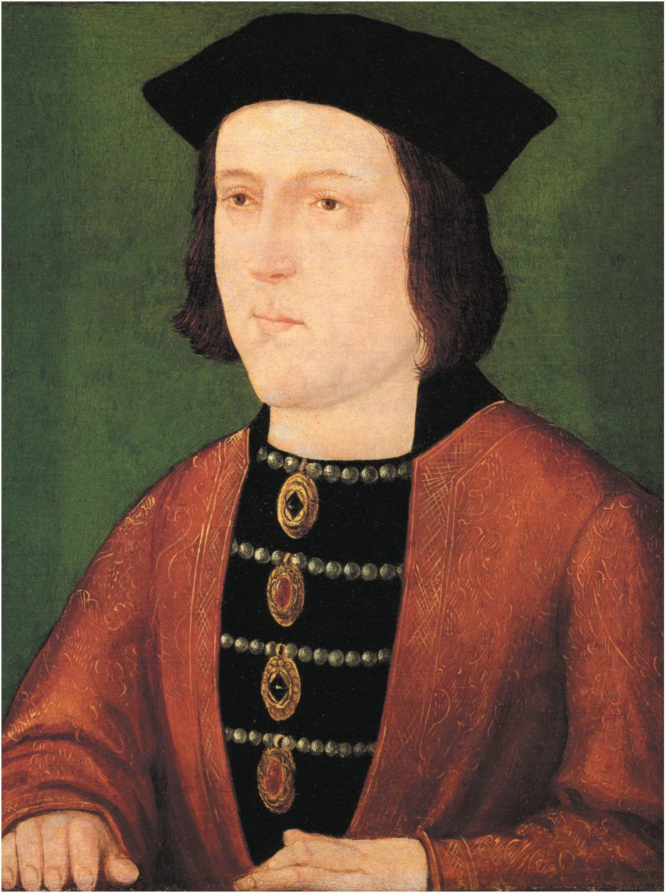
Zestiende-eeuws portret van Edward IV.