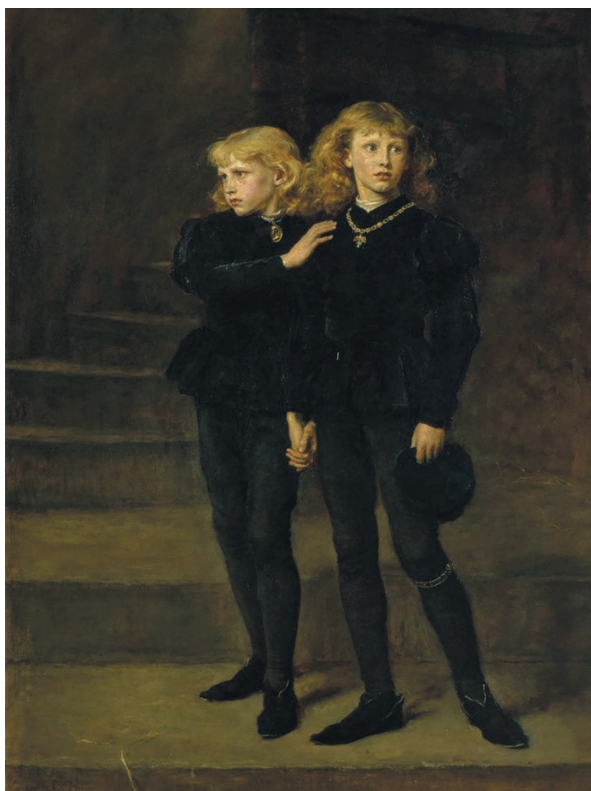
De twee jonge zonen van Edward IV in de Tower.

ben gezegevierd als machtige aristocraten hem niet midden in de strijd hadden verraden.