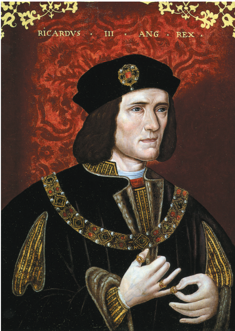
Portret van Richard III.

voren: Hendrik Tudor. In 1485 viel hij Engeland binnen vanuit Frankrijk en versloeg Richard in de Slag bij Bosworth Field, waar de laatste sneuvelde. Het is symptomatisch voor de 'Rozenoorlogen' dat Richard naar alle waarschijnlijkheid zou heb-