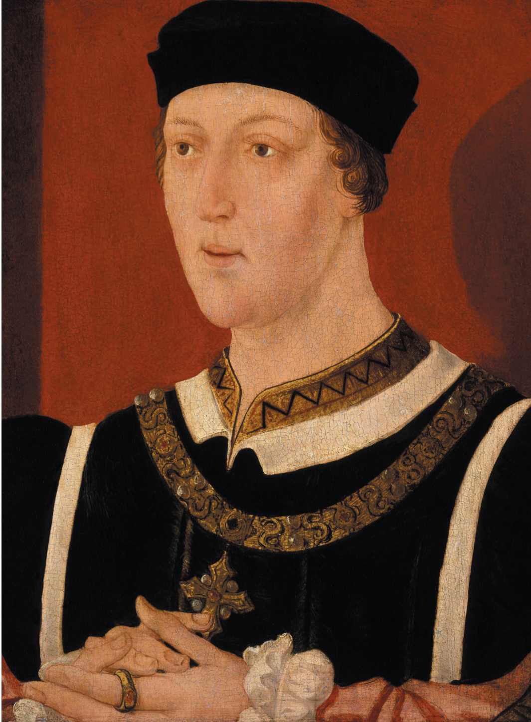
Zestiende-eeuws portret van Hendrik VI.