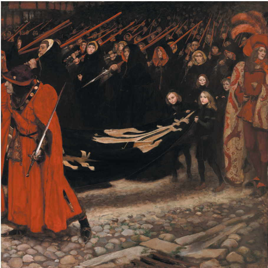
Scène uit Shakespeares stuk Richard III geschilderd door Edwin Austin Abbey, 1890. Richard III verleidt Lady Anne, weduwe van een van zijn slachtoffers, tijdens de rouwstoet voor haar schoonvader Hendrik VI.

tes groef de adel zijn eigen graf. Voortaan waren het de koningen die regeerden en de edelen die gehoorzaamden of werden onthoofd. Het langdurige conflict heeft een mythische glans gekregen, niet in de laatste plaats door de vele literaire werken over de koningen en hun lot. De slotscène in Richard III van