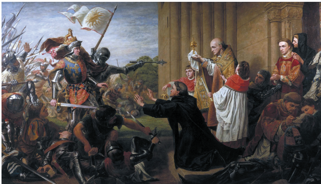
Historiestuk met een priester die Edward IV smeekt gevluhte leden van huis Lancaster te sparen.

Gedurende een paar jaar versterkte Richard III de monarchie naar beste vermogen, onder meer door het parlement en de burgers te bevoordelen, maar ontevreden edelen bundelden hun krachten en schoven een telg uit het huis Lancaster naar