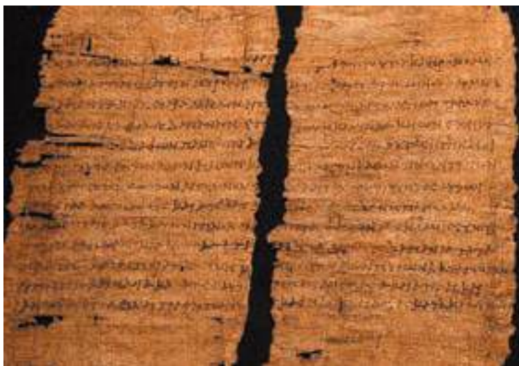
Het papyrusdocument dat werd teruggevonden als wikkel voor een mummie en dat dateert uit de regeringsperiode van Cleopatra.

Cleopatra is dus de koningin die nooit haar eigen geschiedenis heeft mogen schrijven, en die dat ook niet door iemand anders heeft laten doen. Alles wat we van haar hand hebben – en dat is in ieder geval iets, aangezien de meeste mensen die twee millennia geleden leefden geen handtekeningen nalieten – is één woord in een papyrusdocument dat tot op de dag van vandaag bewaard is gebleven omdat het later werd gebruikt als wikkel voor een mummie. Het document bestaat uit een verslag van privileges en belastingvoordelen in Egypte van de hand van de Romein Publius Canidius Crassus, een van de naaste mannen van Marcus Antonius. Het handschrift, gedateerd 23 februari 33 v.Chr., lijkt te zijn opgetekend door een gewone schrijver in de Egyptische bestuursorganisatie, maar helemaal onderaan