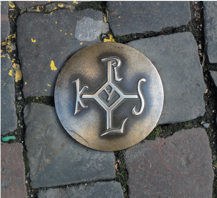
Het beroemde monogram van Karel de Grote, veelvuldig te zien in de binnenstad van Aken.

Al met al geven het beeldje en de beschrijving van Einhard ons een buitengewoon concreet beeld van het uiterlijk van een individuele persoon. Dit is des te vreemder omdat de persoon in kwestie meer dan 1200 jaar geleden stierf, in een fase met een groot gebrek aan bronnen in onze geschiedenis die gewoonlijk wordt geassocieerd met termen als ‘de donkere middeleeuwen’ of in het Engels the Dark Ages . Maar dan gaat het ook over Karel de Grote, een van de ontzagwekkendste en belangrijkste veldheren en imperiumbouwers die ooit heeft geleefd, ook bekend als Pater Europæ : de vader van Europa.