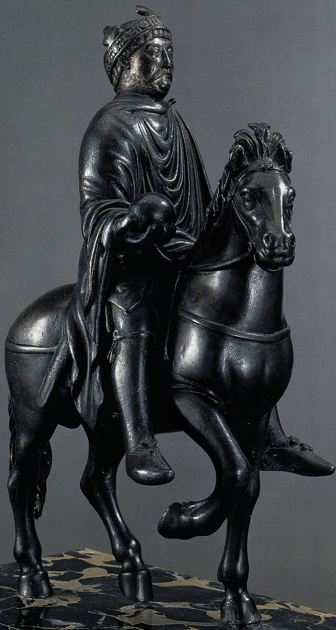
Ruiterbeeld Karel de Grote. Het bronzen beeldje is slechts 24 cm groot en waarschijnlijk vervaardigd door koning Karel de Kale, kleinzoon van Karel de Grote.