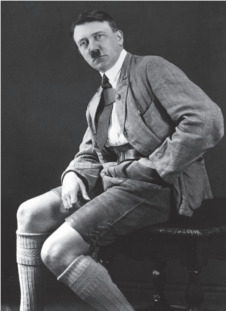
Foto van Hitler voor de putsch in 1923.