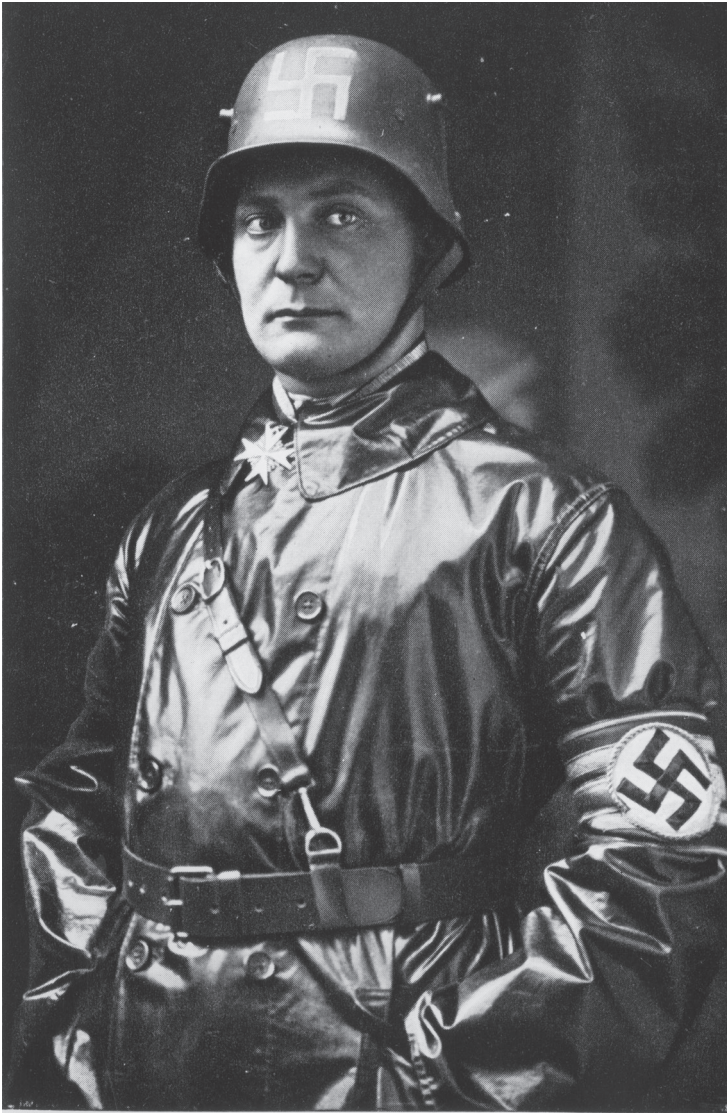
Hermann Göring in SA-outfit in 1923, vlak voor de putsch.