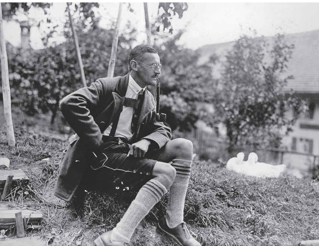
Anton Drexler richtte in 1919 de arbeiderspartij DAP op, de voorganger van de NSDAP.

Hoewel hij aan de dood was ontkomen, had Hitler niettemin een zware terugslag gehad. Zijn 'nationale revolutie'