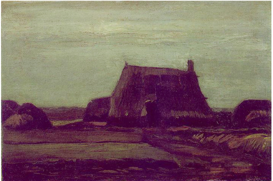
Figuur 2 - Plaggenhut / Huisje met hopen turf door Vincent van Gogh uit circa 1883

Drenthe staat bekend als een provincie met veel groen, rust en ruimte. Het landschap wordt gekenmerkt door hunebedden (bijna alle hunebedden in Nederland zijn in Drenthe) en karakteristieke boerderijen. Drenthe bestond voornamelijk uit woeste gronden met kleine dorpen en een enkele stad. Sinds de 19e eeuw is dit veranderd en is men begonnen met het ontginnen . Door het ontginnen van de woeste gronden, zoals heidevelden, werd er op grote schaal cultuurland (landbouwgrond) verworven. Het uitgangspunt hierbij was dat heidevelden nutteloze gebieden en renteloos kapitaal waren, cultuurgronden leverden meer geld op. In het Zuidwesten gebeurde dit hoofdzakelijk door de Maatschappij van Weldadigheid, door middel van het kolonisatieproject in Frederiksoord .