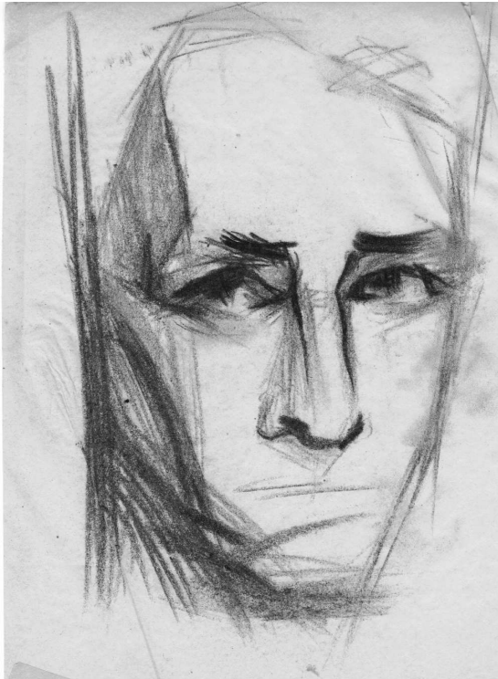
Zelfportret, 18 jaar.